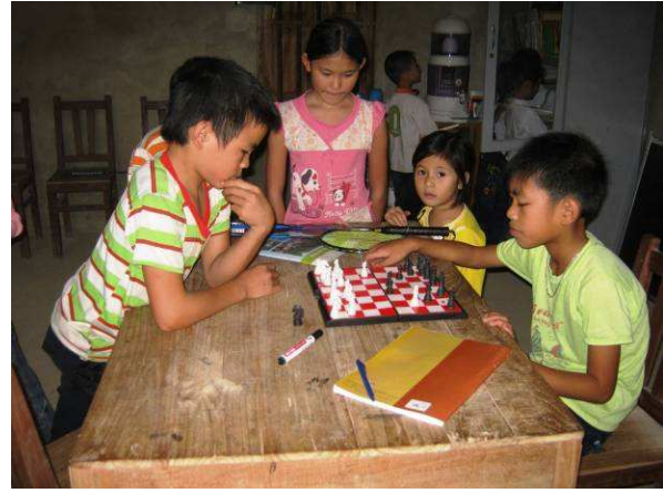
Les clubs enfants ont été équipés de jeux d'échecs