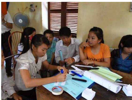
Discussion de groupe lors d'une réunion du club enfant de Thuy Dien

Chaque club est ouvert tous les jours pour que les enfants puissent venir jouer ou lire après l'école. Par ailleurs, les clubs sont ouverts certains jours jusqu'à 21h. Les parents sont les bienvenus, notamment lors des sessions de formation sur les droits et la protection des enfants.