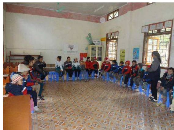
Réunion du club enfant de Thuy Dien