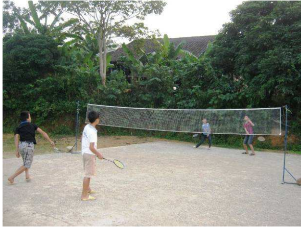
A Na Ca, les enfants jouent au badminton grâce à leur nouvel équipement