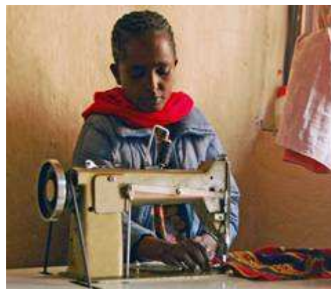
Chaque école recevra 3 machines à coudre

Les directeurs d'école, les associations de parents d'élèves, les professeurs et les élèves sélectionneront ensuite 3 jeunes filles et un professeur par école. Les 15 jeunes filles et les 5 professeurs formeront l'équipe de fabrication et de vente des serviettes hygiéniques. Elles recevront dans un premier temps une formation pratique en couture de 3 à 6 semaines, sur leur temps libre. Cette formation sera dispensée par l'Université Polytechnique de Debre Berhan. Dans un second temps, une autre formation leur sera dispensée et chaque équipe apprendra à coudre les serviettes hygiéniques , durant 10 à 15 jours.