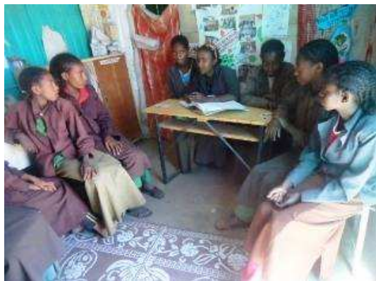
Une réunion d'un Club scolaire de filles

La pérennité de ce projet repose tout d'abord sur l'implication de ses bénéficiaires dans sa définition et sa mise en œuvre. Ainsi les jeunes filles, au travers de leur Club scolaire, seront responsables de la production et de la bonne distribution des serviettes. La part de responsabilité donnée aux bénéficiaires et la sensibilisation effectuée préalablement leur permettront de s'approprier le projet. La marge de manœuvre qui leur sera laissée (pour la clé de répartition des produits de la vente, pour l'identification des bénéficiaires, etc.) permettra également de faire de ce projet « leur projet ».