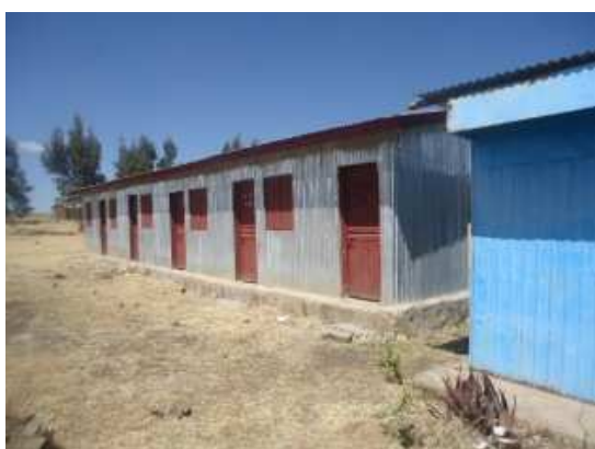
Les locaux des différents Clubs de l'école primaire de Keyit

Les écoles de Keyit, Bakelo, Abamote, Mush et Gudoberet sont soutenues par notre partenaire ChildFund Éthiopie. Toutes disposent d'une bibliothèque, et celle d'Abamote a été construite grâce aux donateurs d'Un Enfant par la Main.