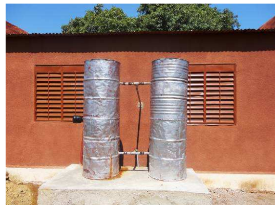
Façade arrière de la maison et installation du système de refroidissement