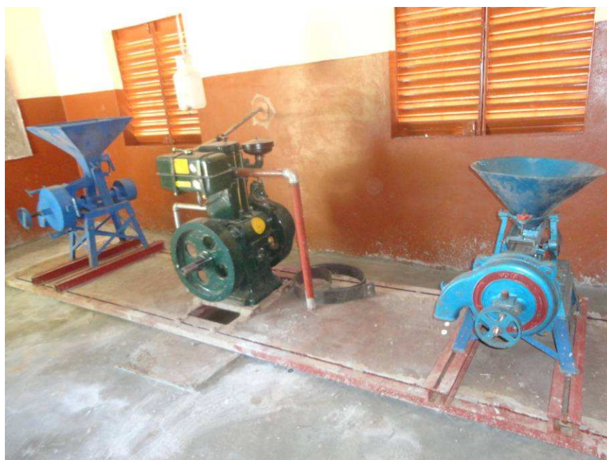
Une nouvelle ère commence pour les femmes de Toukoro !