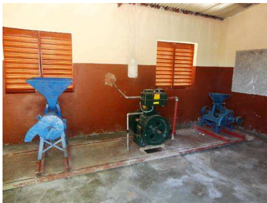
Installation du moulin

L'entreprise s'est ensuite occupée d'installer ces différents éléments et de faire en sorte que le nouveau moulin soit fonctionnel et opérationnel.