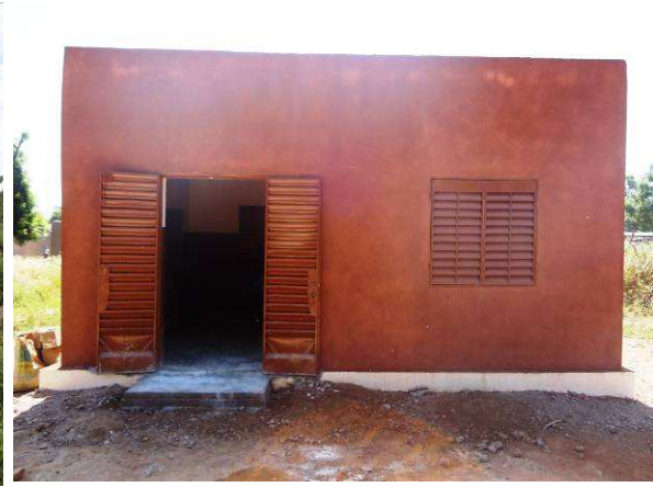
La maison accueillant le nouveau moulin de Toukoro