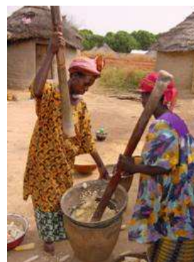
Les femmes maliennes perdent beaucoup de temps et d'énergie à la mouture traditionnelle du grain

En plus des tâches ménagères telles que l'approvisionnement en eau et la vaisselle, moudre le grain est une activité nécessaire au quotidien pour la préparation des repas et pour produire du beurre de karité. Le beurre de karité est utilisé pour cuisiner et parfois vendu afin de dégager des revenus. Dans de nombreuses zones rurales, des moyens traditionnels, peu efficaces et épuisants sont utilisés pour réaliser la mouture.