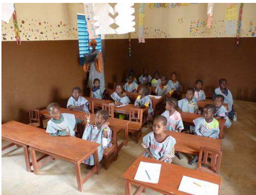
Les enfants dans leur classe d'éveil joliment décorée