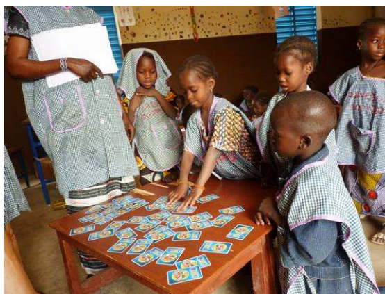
Les enfants jouant avec la mère éducatrice

D'autre part, la situation nutritionnelle des 50 enfants accueillis s'améliore progressivement grâce aux goûters à base de nourriture enrichie. Cette situation devrait s'améliorer encore et s'étendre aux autres enfants de moins de 5 ans du village, une fois que les autres activités nutritionnelles auront démarré.