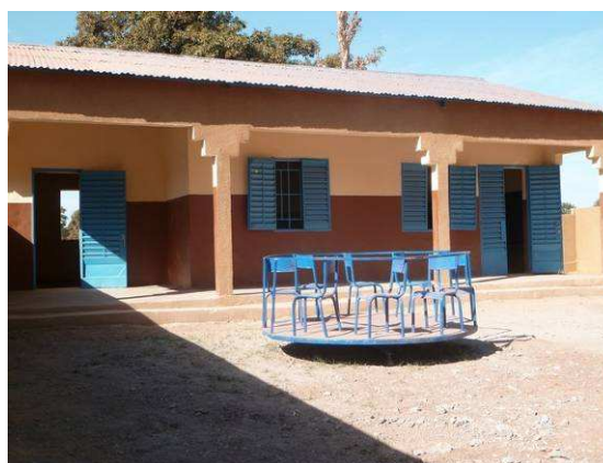
L'entrée de l'USDE - La cours et le manège devant la classe d'éveil (à droite) et la réserve (à gauche)