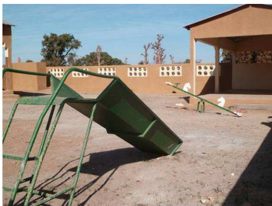
Le toboggan et la balançoire bascule