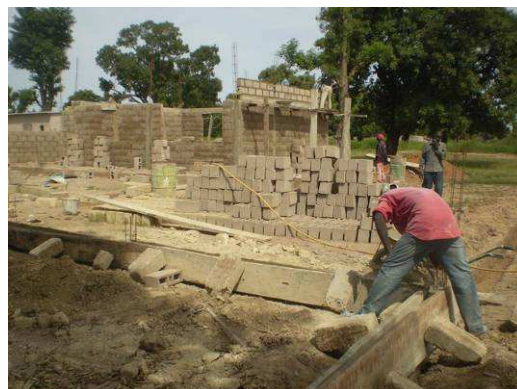
Les premiers murs de l'USDE sont construits