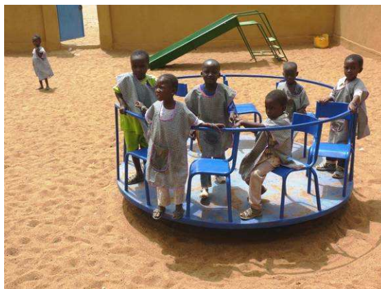
Les enfants à la récréation