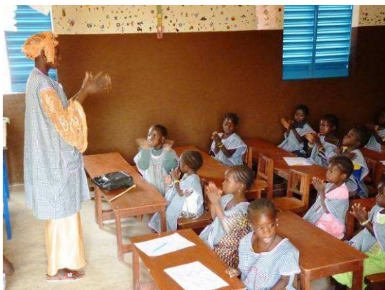
Les enfants au sein de la classe d'éveil

Comme, elles font désormais parties intégrantes du programme nutritionnel global de Børnefonden Mali, et étant mises en place conjointement avec celles d'autres villages, les activités nutritionnelles devraient démarrer au troisième trimestre scolaire 2011, soit vers le mois de mai.