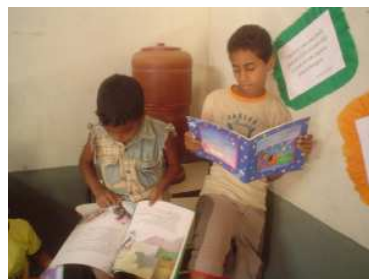
Les enfants découvrent leur sac de livres et les nombreux ouvrages qu'il contient