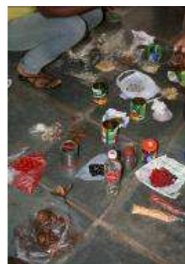
Echange de graines, symboles d'intégration et de construction

Cet atelier a permis de mettre en évidence les progrès accomplis dans le cadre des activités des Maisons Culturelles, mais aussi de souligner les défis communs qui restent encore à relever. Ce moment s'est clôturé sur l'échange symbolique de jouets et de graines typiques de chaque région.