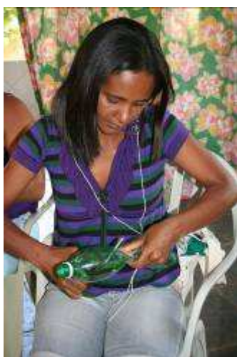
Fabriquer de ses propres mains

Pendant trois jours, du 16 au 19 octobre 2009, ces professionnels se sont rencontrés dans la ville de Virgem da Lapa, située dans la vallée de Jequitinhonha et ont participé aux ateliers de formation proposés :