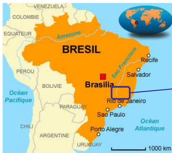
Carte du Brésil

Renforcement et extension du projet « Horizons » : valorisation de l'héritage culturel pour une meilleure éducation