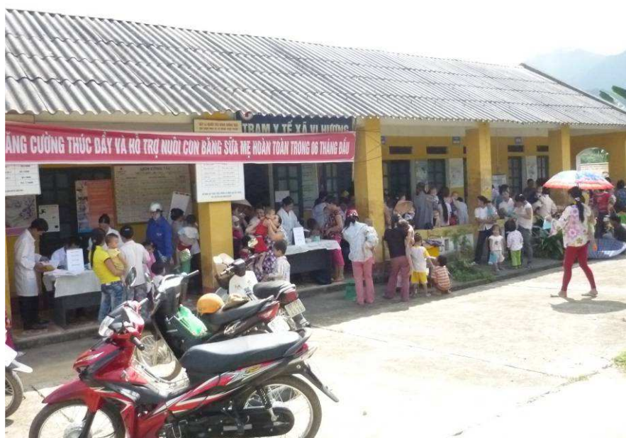
Le centre de santé de Vy Huong