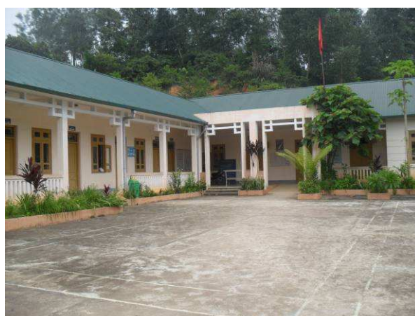
Le centre de santé de Con Minh