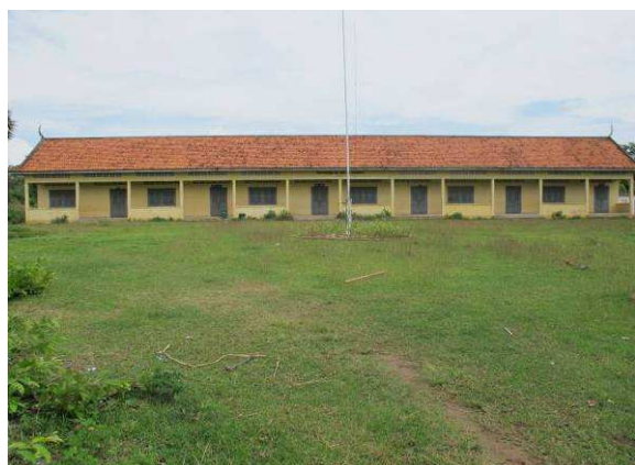
Ecole primaire du village de Beong Kieb