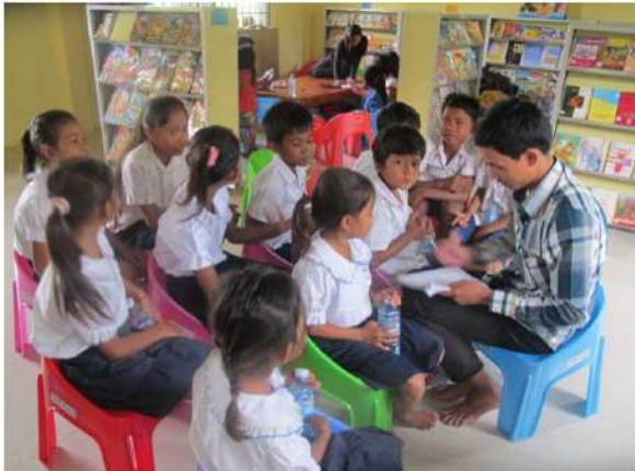
Les élèves de l'école de Boeng Kieb

« Avant d'avoir cette bibliothèque, les élèves ne semblaient pas travailler énormément car il n'étaient pas très intéressés par l'école, qu'il voyaient comme ennuyeuse et sans saveur.