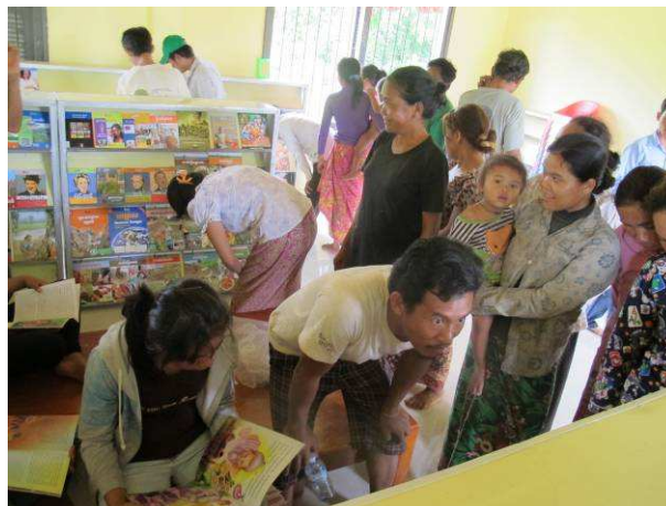
Les parents découvrent la bibliothèque de Veal Kansaeng

L'équipe de ChildFund Cambodge, en consultation avec les administrateurs des écoles, a déterminé les ressources prioritaires à mettre en place dans chacune des deux écoles. En fonction des besoins identifiés, l'équipe de ChildFund Cambodge s'est occupée de finaliser la sélection des livres à acheminer vers les deux bibliothèques, en se référant aux lignes directrices du Gouvernement en la matière.