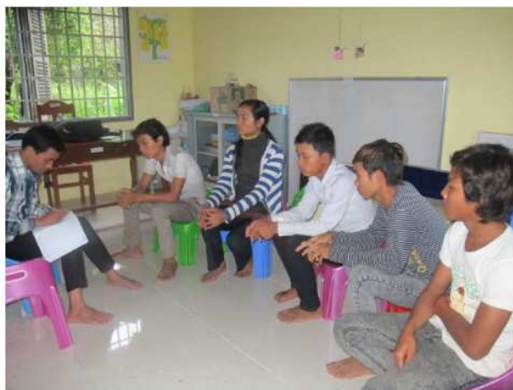
Les bibliothécaires bénévoles de l'école de Boeng Kieb

Je m'attends à ce que le nombre d'enfants qui s'inscrivent à l'école et accèdent à la bibliothèque lors de la prochaine année scolaire augmente. Je souhaite que ChildFund Cambodge puisse continuer à nous appuyer dans la gestion de la bibliothèque et nous fournir plus de livres pour encourager les élèves à lire. Le Comité de l'école a prévu de mobiliser à la fois les ressources locales et extérieures pour s'assurer que la bibliothèque fonctionne correctement, sur le long-terme ».