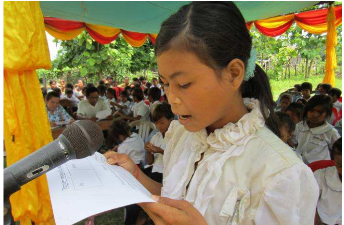
Lors de la compétition de lecture dans l'école de Beong Kieb

Les résultats de ces compétitions ont été affichés dans les deux écoles primaires et dans les locaux de ChildFund Cambodge.