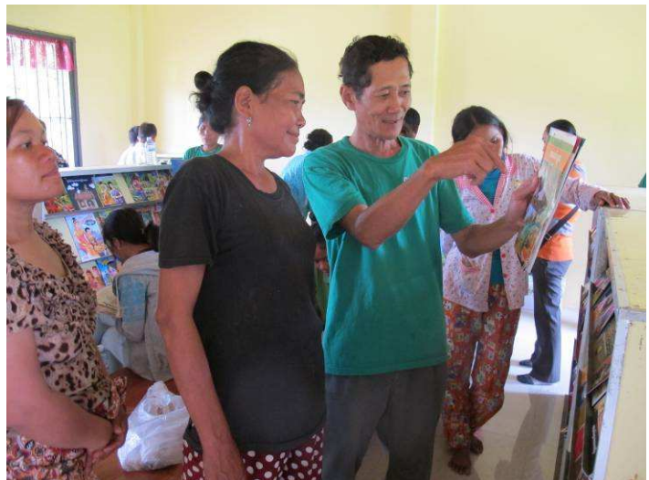
Un formateur du Conseil du district de l'Éducation explique aux parents d'élèves comment trouver un livre dans la bibliothèque

Six bibliothécaires par bibliothèque ont été sélectionnés par les autorités locales parmi les jeunes du village. Tous volontaires, ces bibliothécaires ont reçu une formation dispensée par des formateurs du Ministère de l'Éducation au niveau du district et de la province. Ils aident les professeurs à gérer les bibliothèques et adressent au Comité de gestion un rapport mensuel.