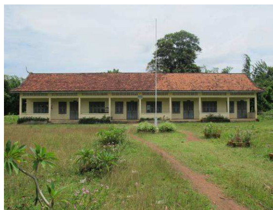
Ecole primaire du village de Veal Kansaeng