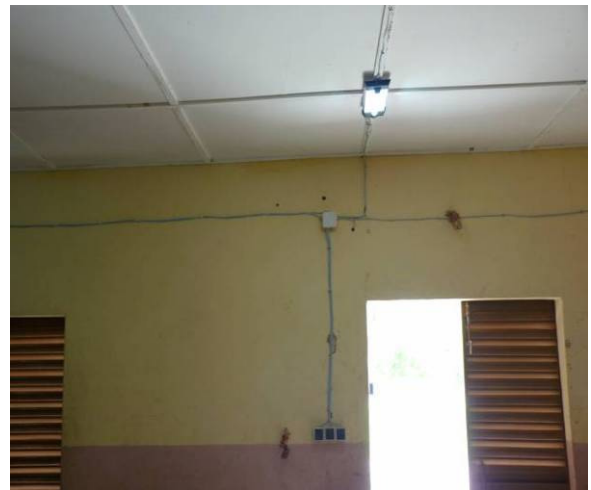
Les interrupteurs permettront d'allumer les ampoules le soir venu.