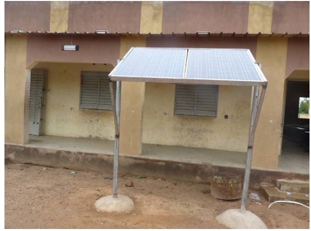
Le panneau solaire installé