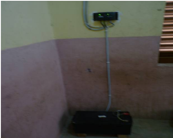
Le régulateur qui fournit l'énergie emmagasinée par le panneau solaire.