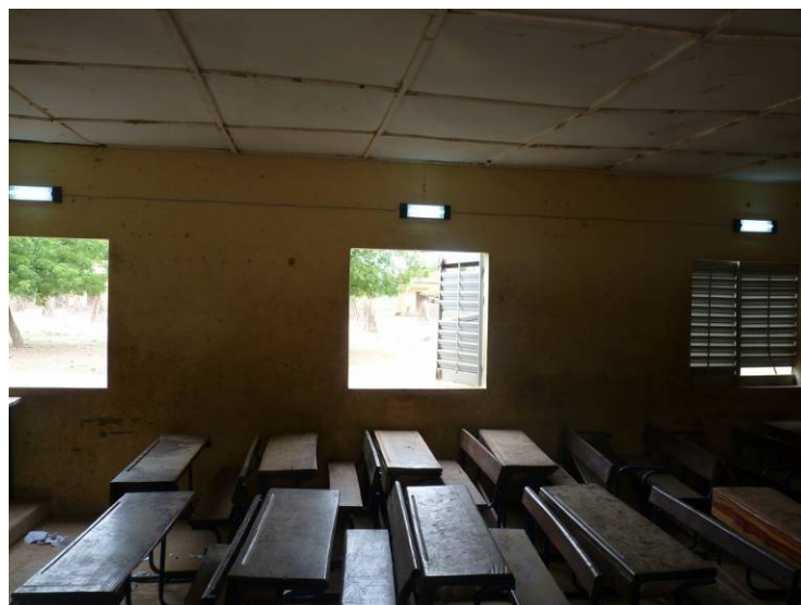
Désormais, les enfants pourront étudier et faire leurs devoirs après l'école, même lorsqu'il fera nuit !