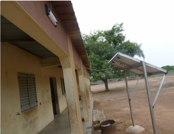
Le panneau solaire permettra d'éclairer les ampoules dans les salles de classe et à l'extérieur de l'école