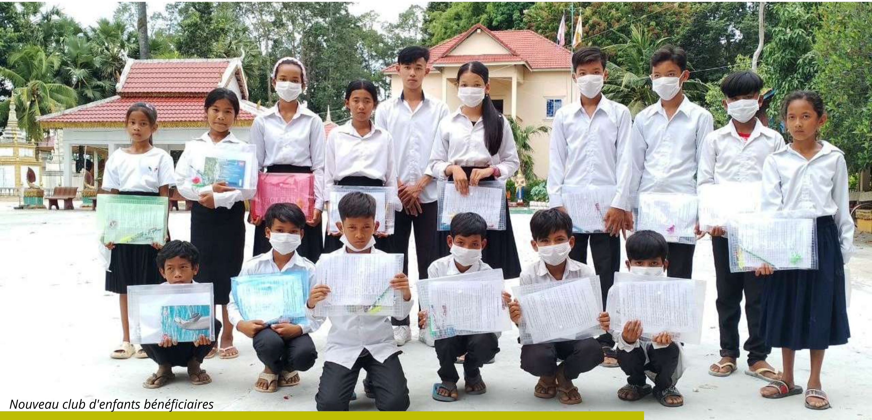
Nouveau club d'enfants bénéficiaires