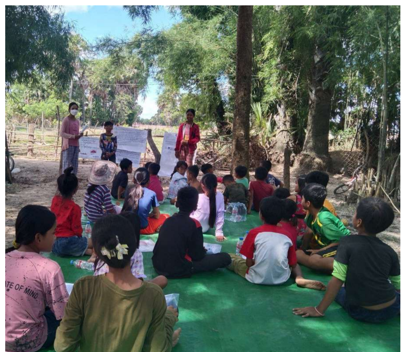
Les jeunes volontaires forment les membres des clubs d'enfants volontaires pour mener des sensibilisations communautaires