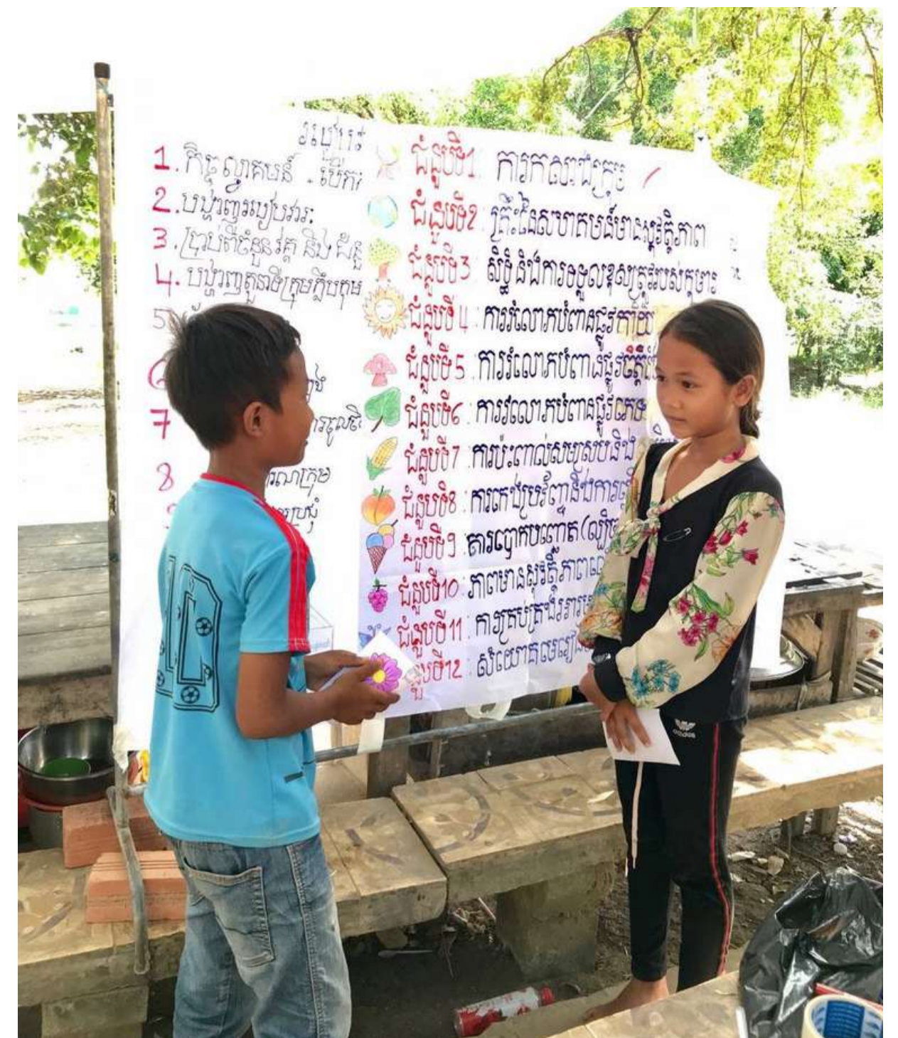
Séance de rappel auprès d'un groupe formé en phase 1 (2021) du projet

ChildFund Cambodge a travaillé en étroite collaboration avec les jeunes volontaires communautaires pour aider les clubs d'enfants à organiser des sensibilisations ou évènements afin de promouvoir leurs droits et soulever leurs préoccupations liées à la protection de l'enfance dans les communautés.