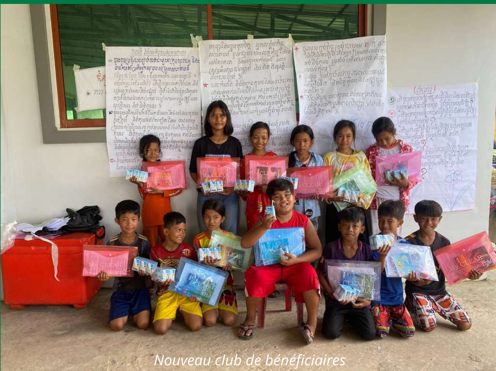
Nouveau club de bénéficiaires

Au total, 408 enfants (dont 230 filles) âgés de 12 à 17 ans , à la fois scolarisés et non scolarisés, ont rejoint 26 nouveaux clubs (environ une quinzaine d'enfants par club).