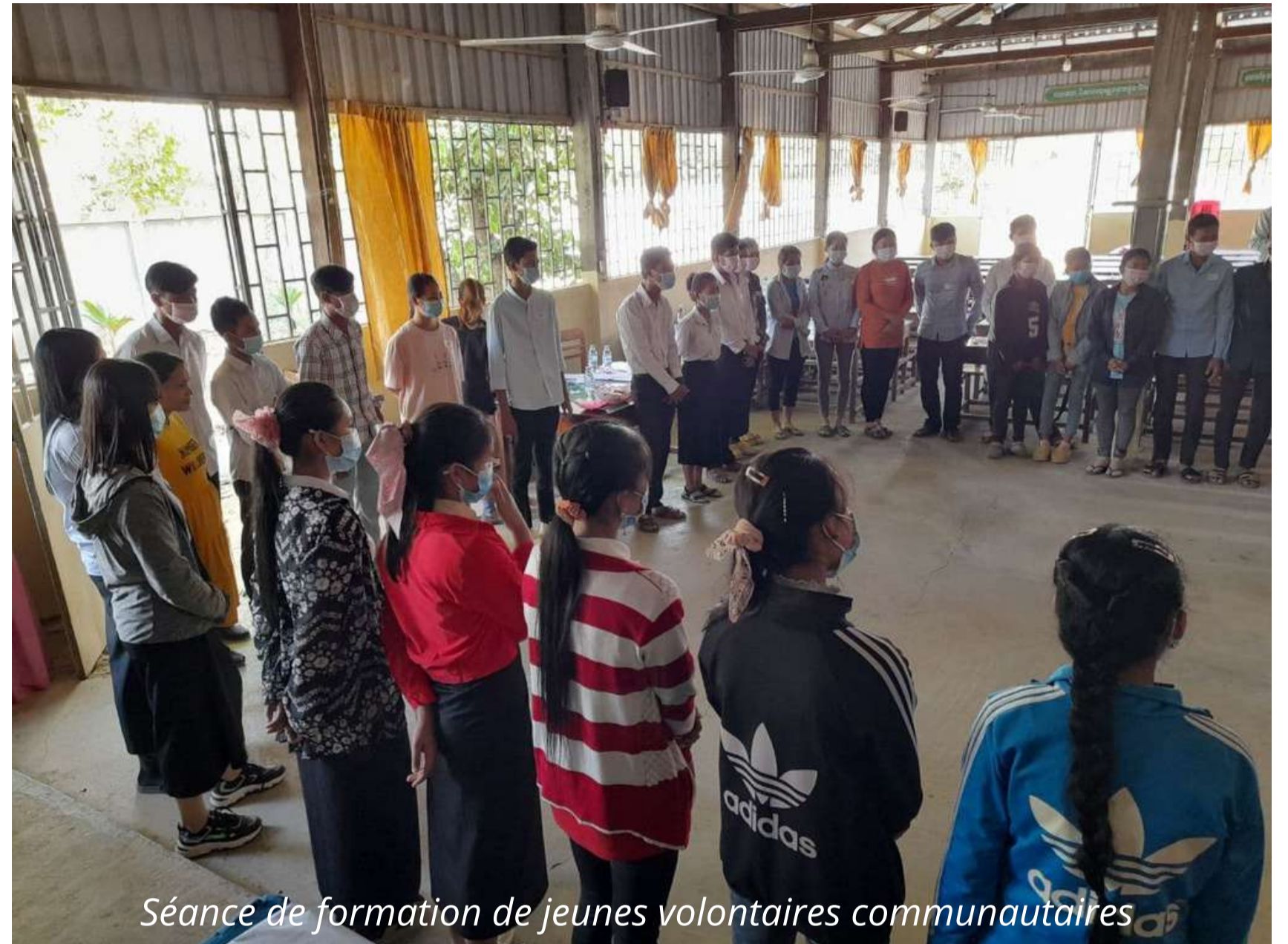
Séance de formation de jeunes volontaires communautaires

Les équipes de ChildFund Cambodge et WOMEN ont dispensé des formations à 56 jeunes volontaires communautaires (dont 44 filles) , sur la protection de l'enfance et plus particulièrement les comportements d'autoprotection . Les séances portaient également sur les techniques de communication et d'animation, ainsi que sur l'utilisation du manuel d'autoprotection élaboré par ChildFund Cambodge, les jeunes étant amenés à partager leurs connaissances auprès des enfants.