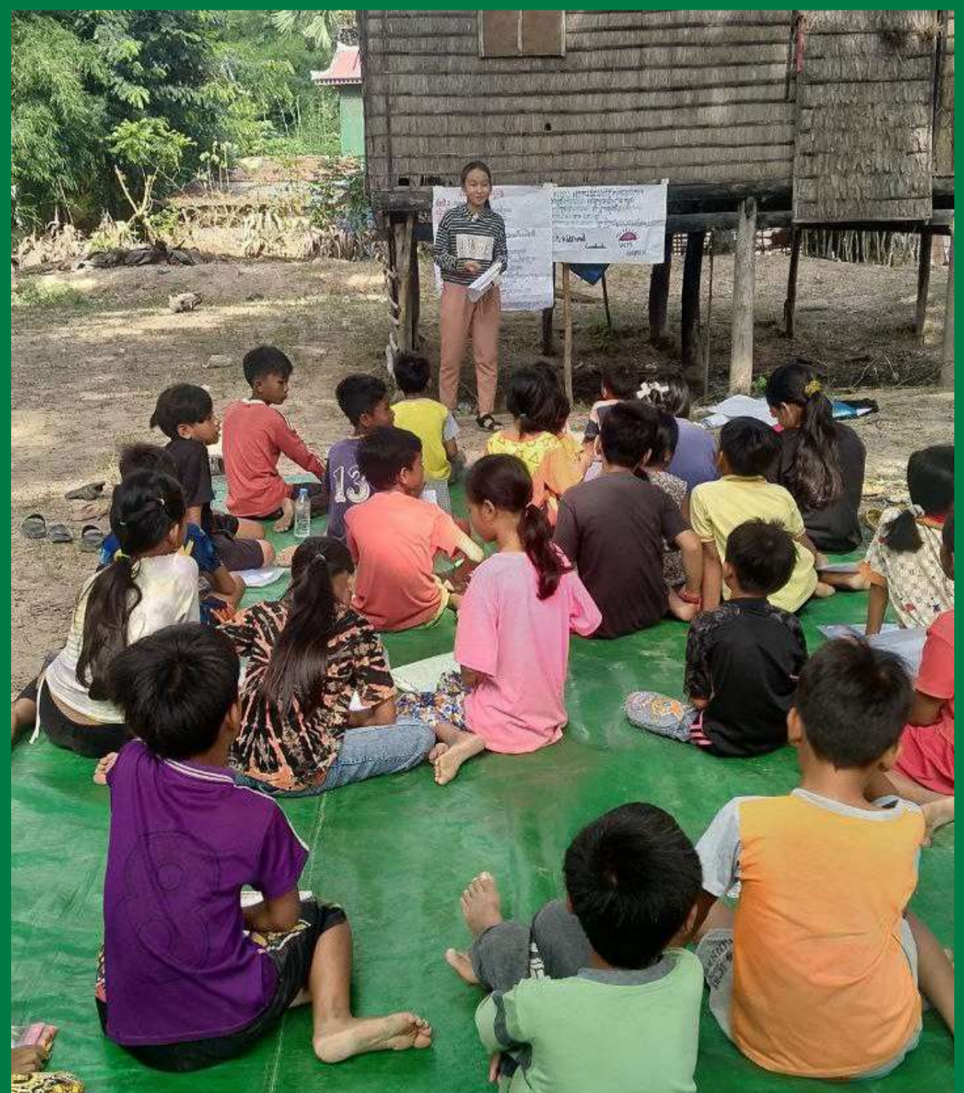
Des jeunes volontaires communautaires animent des séances auprès des clubs d'enfants

Des pré-tests et post-tests ont été utilisés pour évaluer le niveau de connaissance et de compréhension croissante des participants au début et à la fin des sessions.