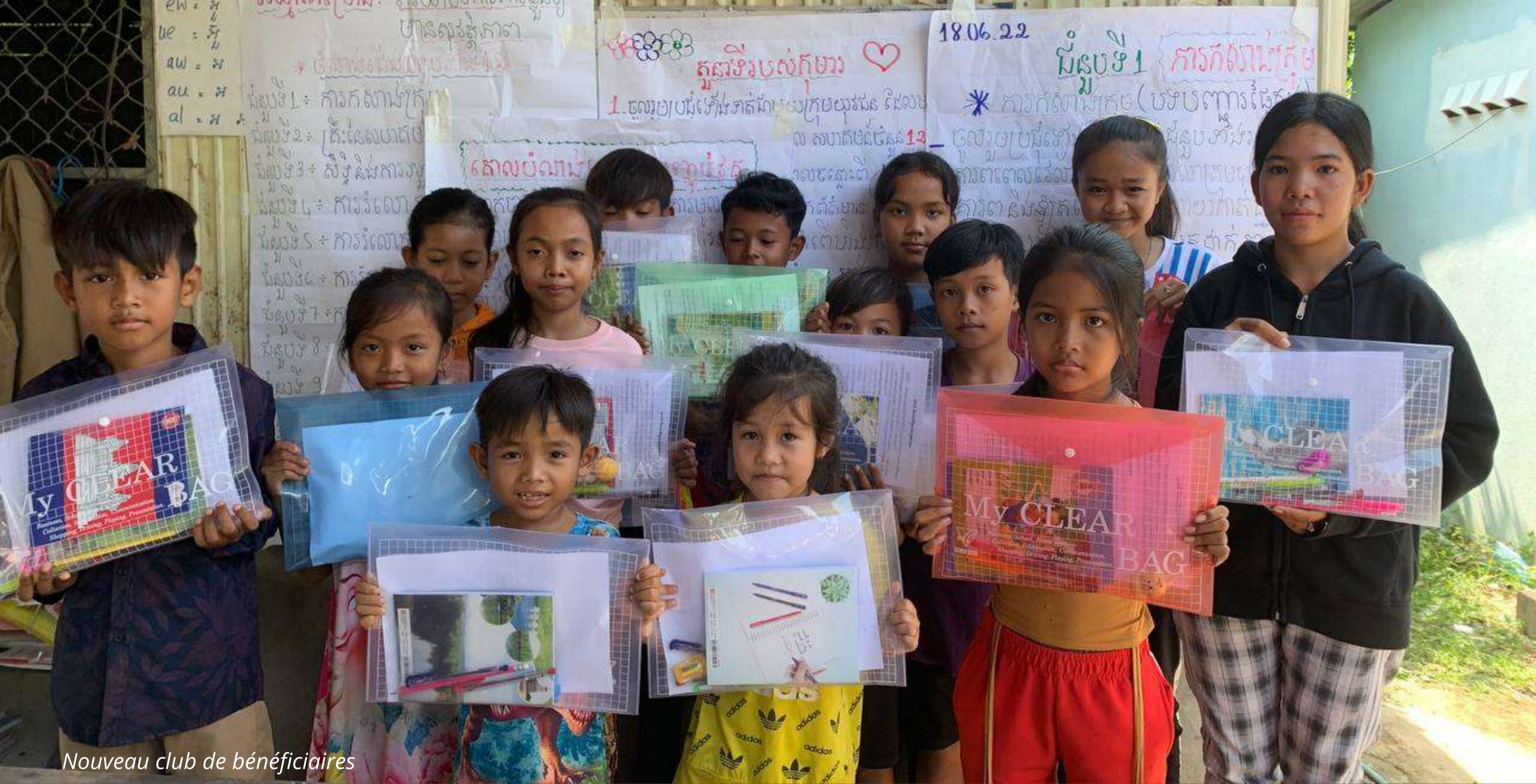
Nouveau club de bénéficiaires