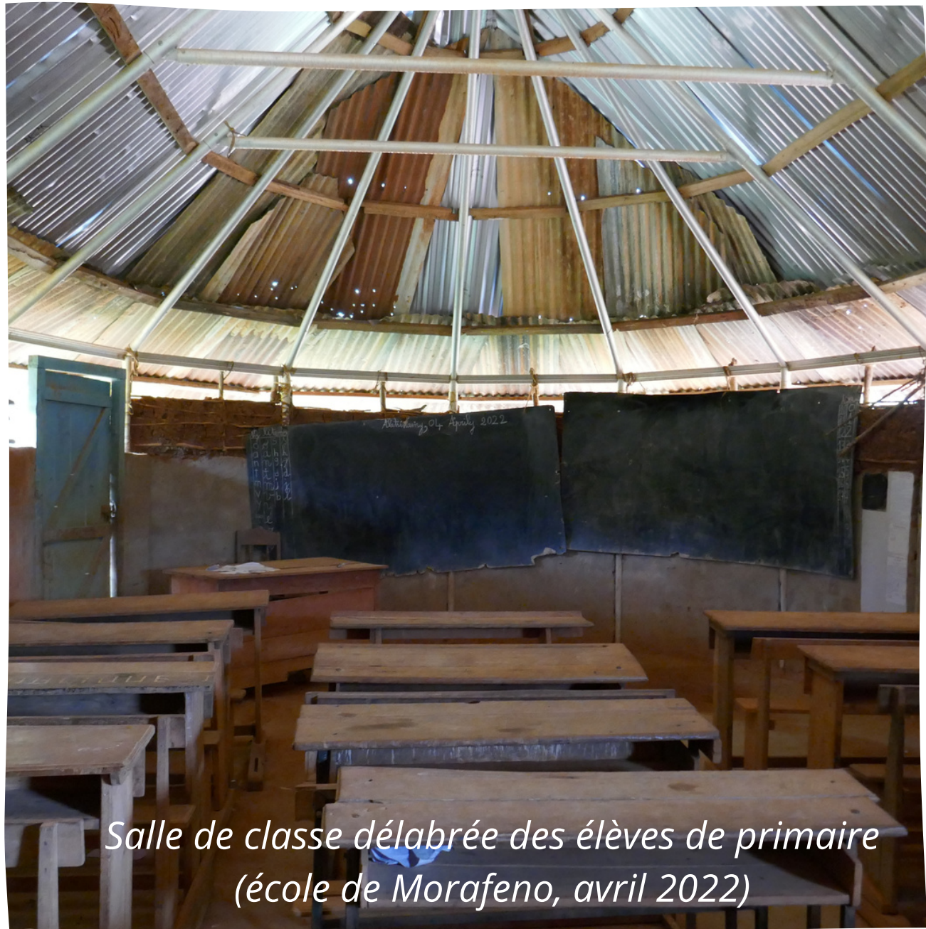
Salle de classe délabrée des élèves de primaire (école de Morafeno, avril 2022)

A Madagascar, des milliers d'enfants sont laissés pour compte et n'ont toujours pas la possibilité de s'instruire. Pour ceux étant déjà rentrés dans une salle de classe, ils ne sont que 56% à achever le cycle de primaire, soit plus d'1 enfant sur 2 qui abandonne l'école prématurément . Les obstacles à cette scolarisation sont multiples : distance domicile-école, capacités d'accueil restreintes, difficulté à faire face aux coûts associés à la scolarisation, contribution des enfants aux obligations familiales durant la période de soudure, mais aussi les mariages ou grossesses précoces, ou encore l'absence à l'école en raison de maladies liées à un faible accès à des soins et à des services d'eau potable.