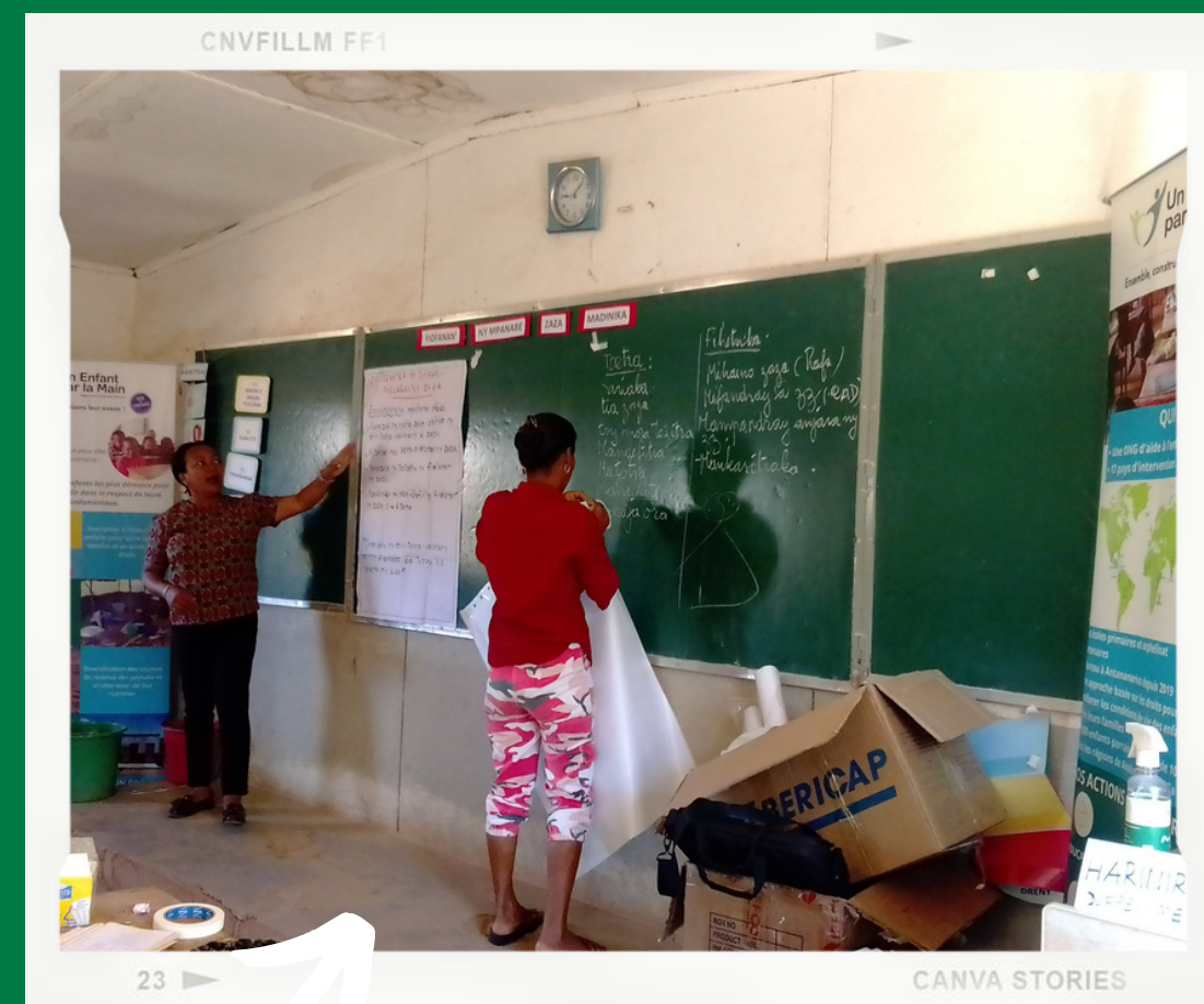
Formation des éducatrices du préscolaire (août 2022)

Permettre à ces éducateurs d'accéder à une formation de qualité contribuera à créer un cercle vertueux : les enseignants nouvellement formés pourront proposer un enseignement de meilleure qualité aux élèves, qui seront eux-mêmes mieux formés et préparés pour prendre en main leur avenir.