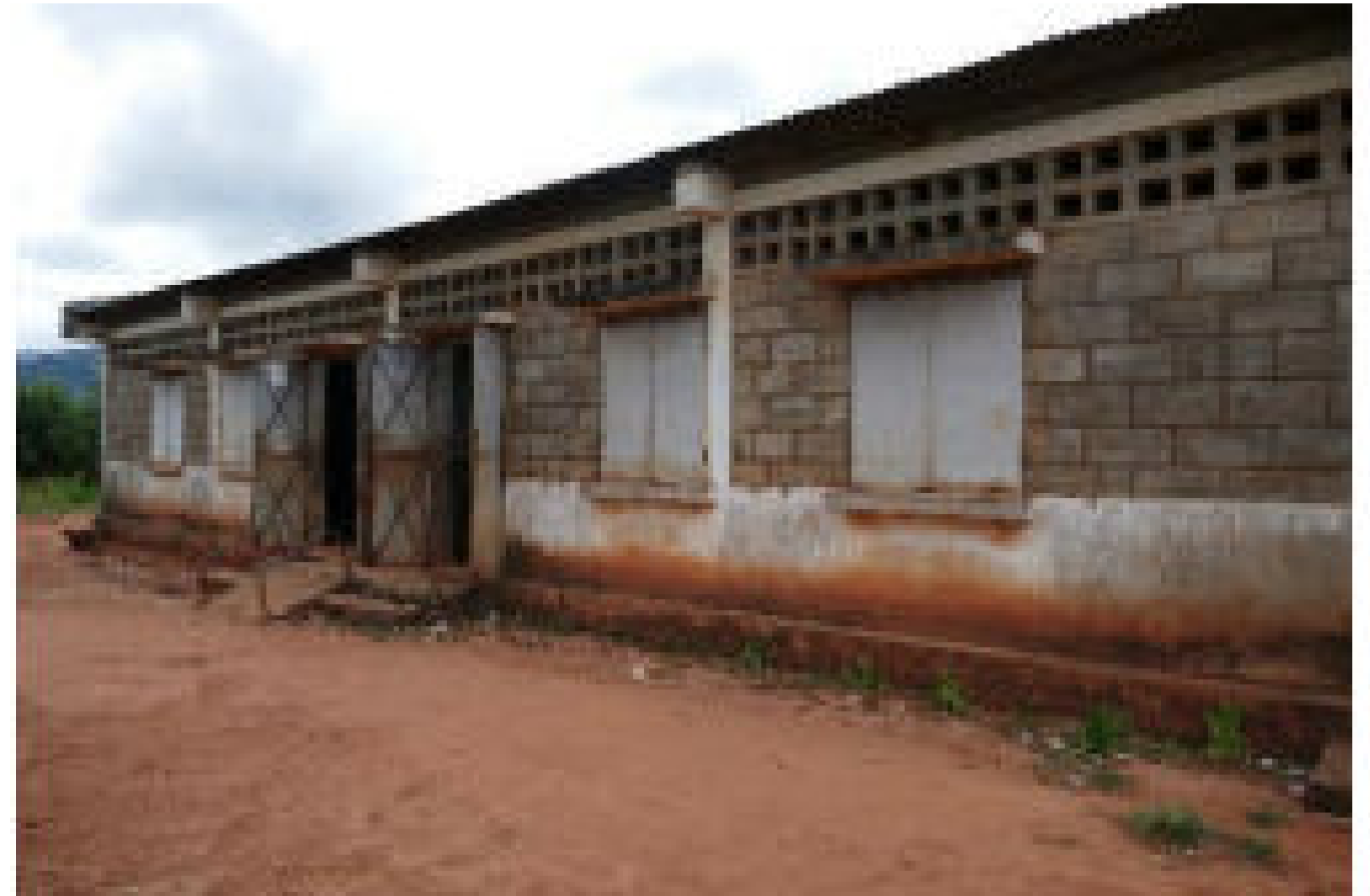
Bâtiment surplombant le domaine scolaire et accueillant les élèves de CM1 et CM2