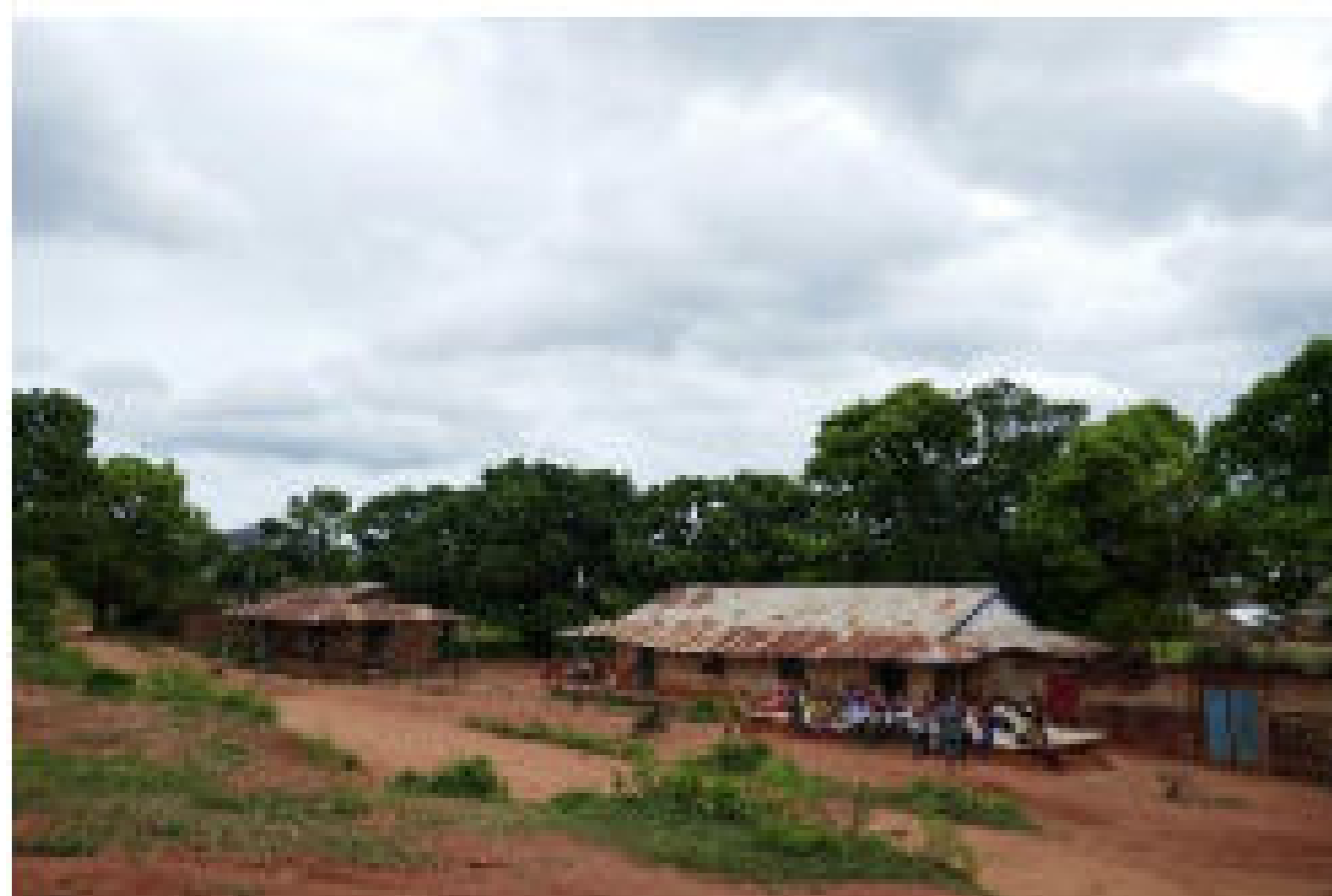
Vue sur la cour de l'école