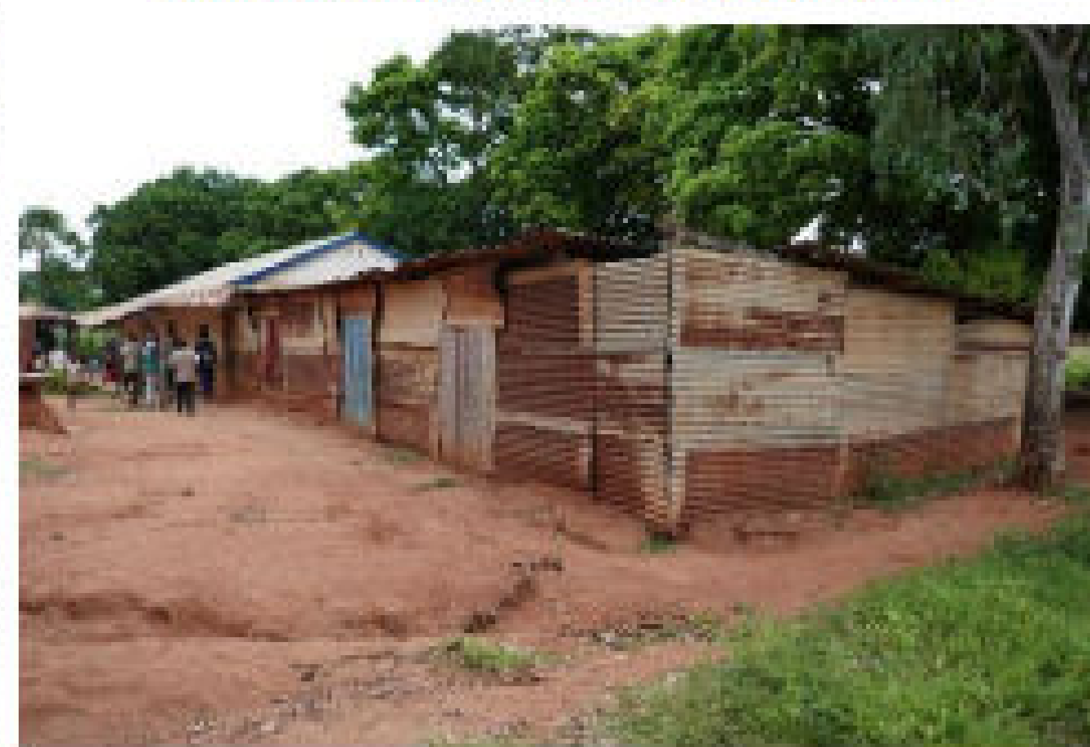
Bâtiment construit il y a plusieurs années par les villageois accueillant actuellement les élèves de primaire