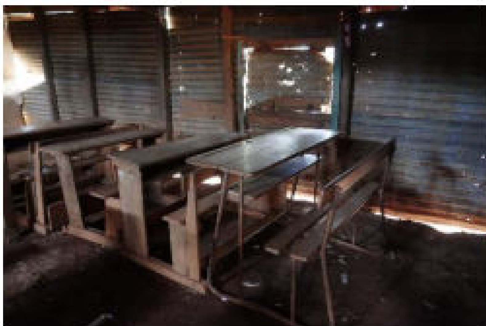
Intérieur d'une salle de classe accueillant des élèves de primaire