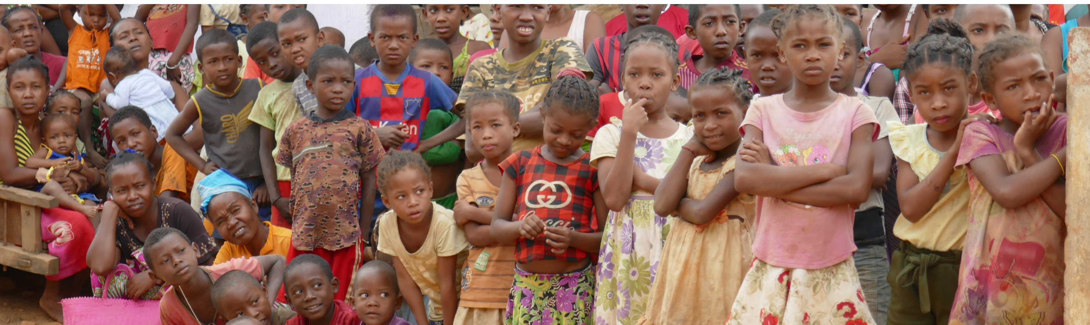
Enfants de la commune de Morafeno lors d'un rassemblement

S'ajoutent également les parents des enfants scolarisés au sein de ces 4 écoles , soit environ 2 000 personnes supplémentaires.