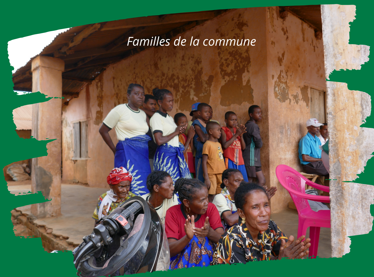
Familles de la commune

L'école ayant un rôle important pour l'accès à des services essentiels de qualité et le changement de comportements, des activités seront également entreprises en milieu scolaire afin de lutter contre les obstacles à un apprentissage efficace et à un bon développement des enfants , telles que la promotion de bonnes pratiques d'hygiène. Ces actions permettront d' améliorer à moyen et long terme le développement physique et cognitif des enfants , mais aussi d'agir sur d'autres droits de l'enfant bafoués à Morafeno.