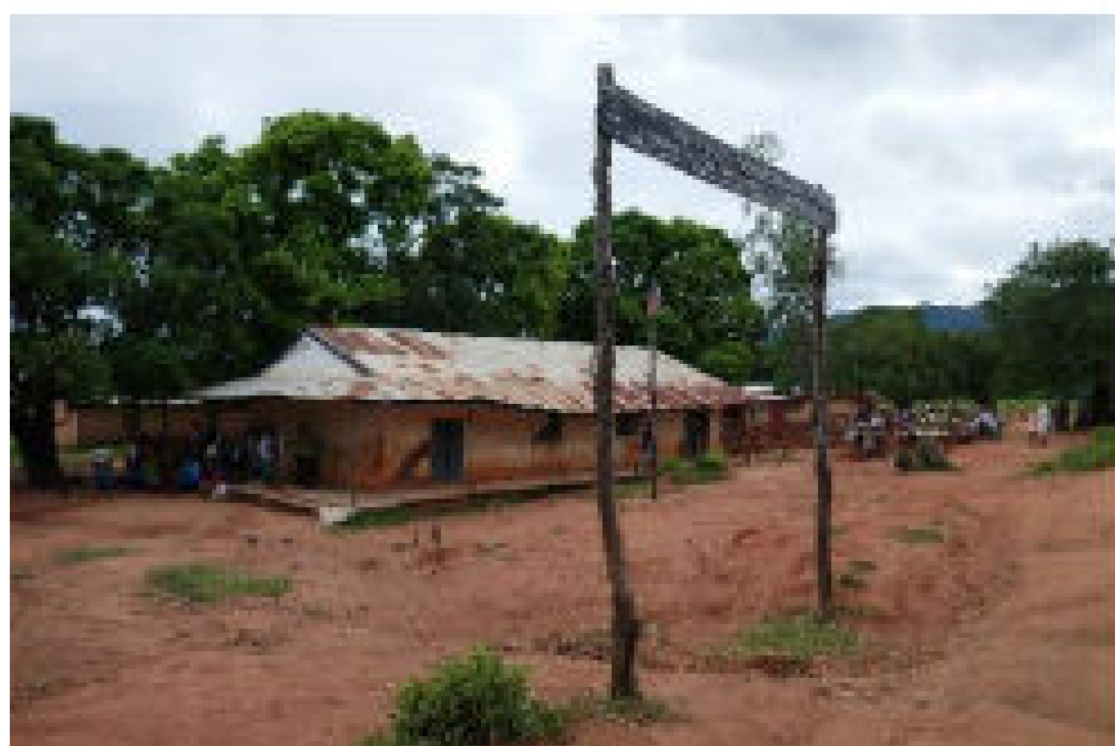
Entrée principale de l'école