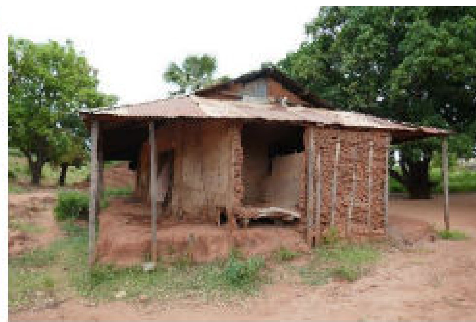
Bâtiment abritant la salle de direction