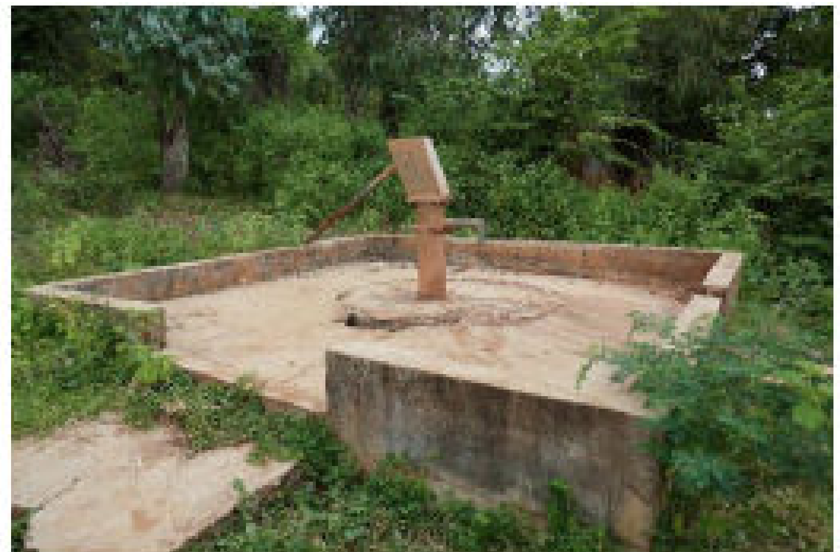
Pompe actuellement non fonctionnelle