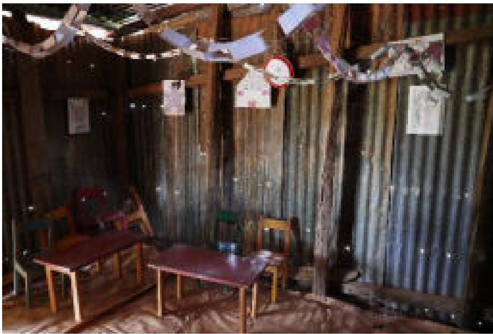
Intérieur d'une salle de classe accueillant des élèves de préscolaire