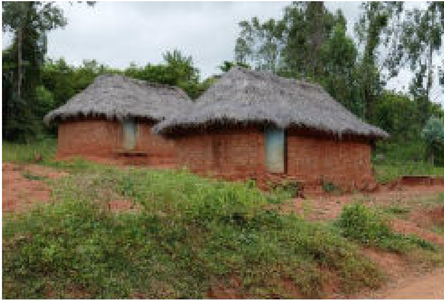
Bâtiments construits par l'UNICEF en 2003 et accueillant les élèves de préscolaire et primaire