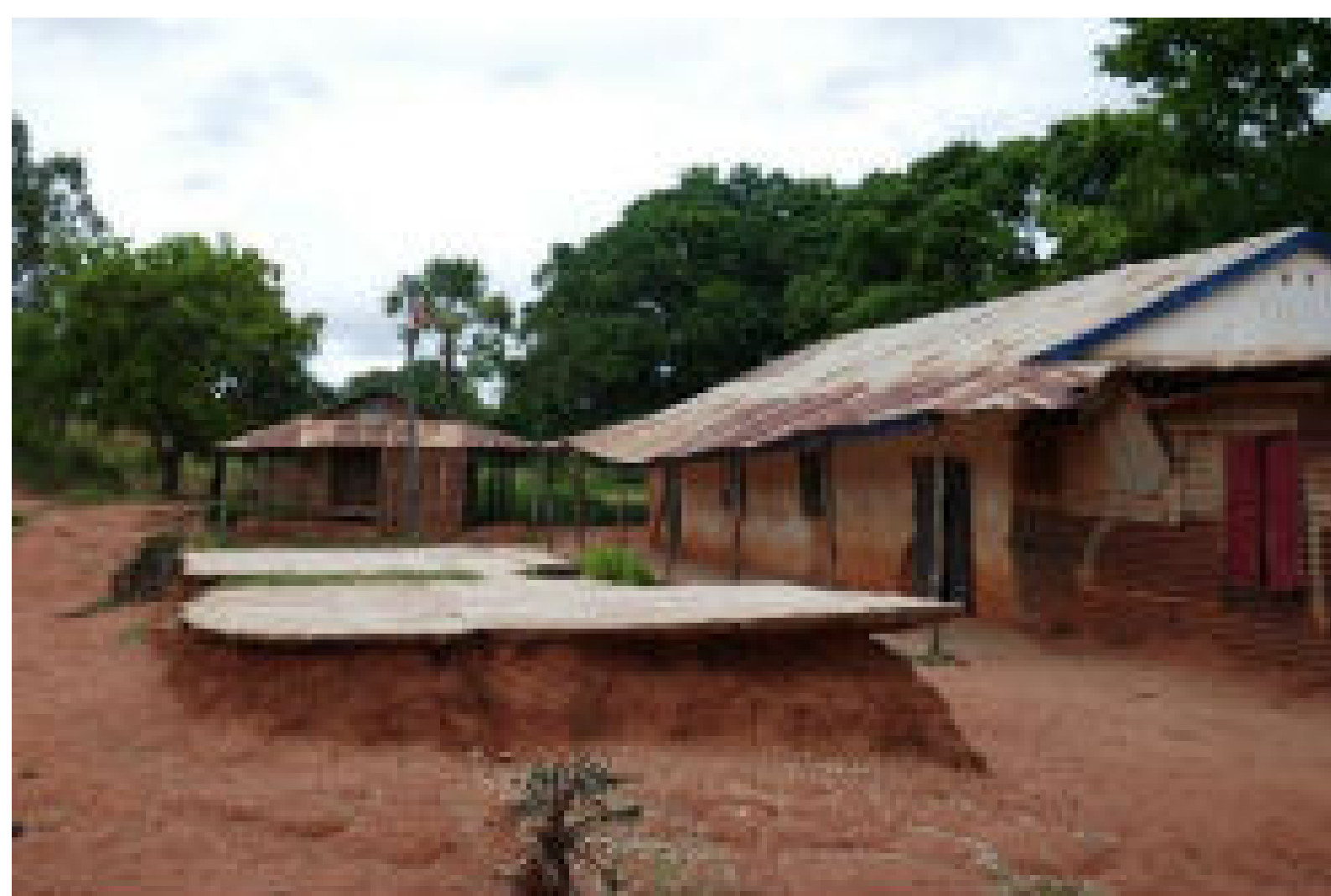
Cour principale de l'école