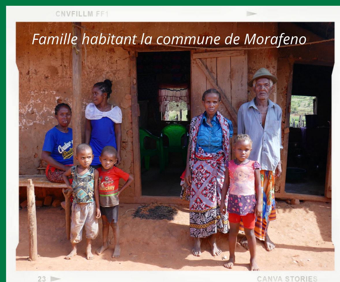
Famille habitant la commune de Morafeno