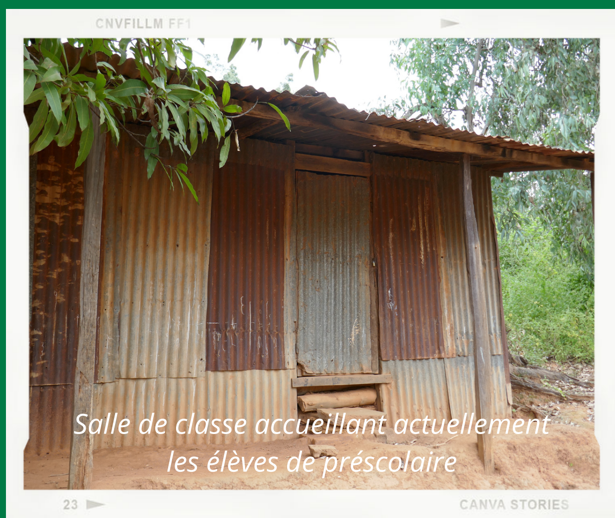
Salle de classe accueillant actuellement les élèves de préscolaire

Afin d'améliorer les infrastructures scolaires de la zone qui sont en très mauvais état, 3 nouvelles salles de classes sont actuellement en cours de construction au sein de l'école de Morafeno. Elles seront équipées en mobilier grâce à vos dons. UEPLM prévoit également d'améliorer les infrastructures des 3 autres écoles de la zone d'ici 2025 (financement hors projet). Au delà des infrastructures, UEPLM prévoit d'équiper les 4 écoles de la zone du projet en matériel pédagogique , et les salles seront décorées avec des matériaux locaux, confectionnés par les enfants eux-mêmes. Ces travaux seront organisés lors d'ateliers organisés sur une journée.