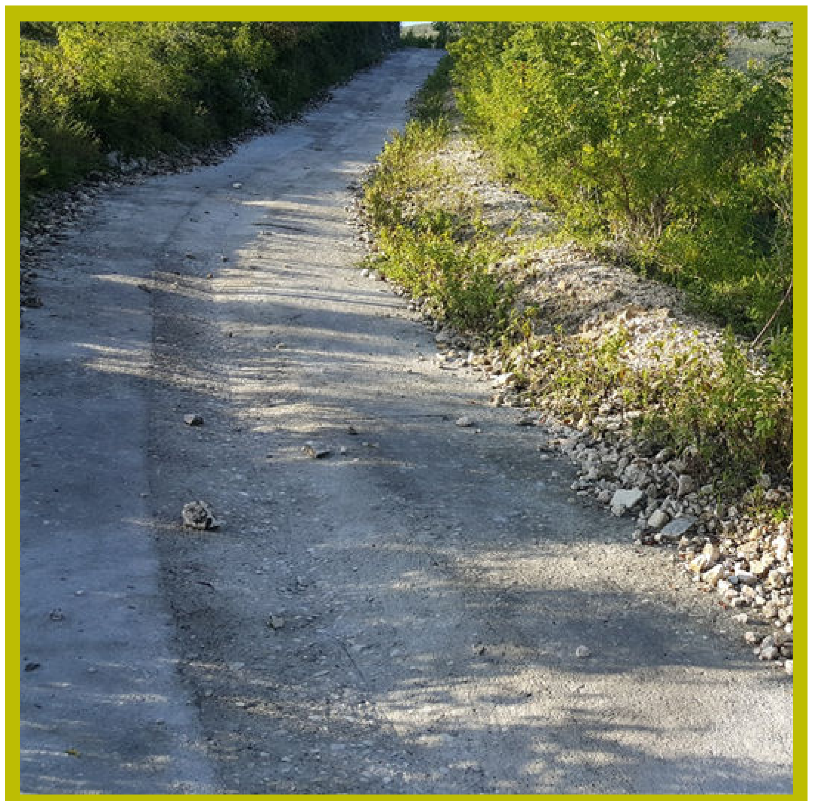
Morne Marino avant (photo de gauche) et après (photo de droite) réhabilitation par UEPLM

Ces impacts positifs ont été formulés par les utilisateurs de la piste de Morne Marino, réhabilité en 2019-2020 par l'équipe d'UEPLM.