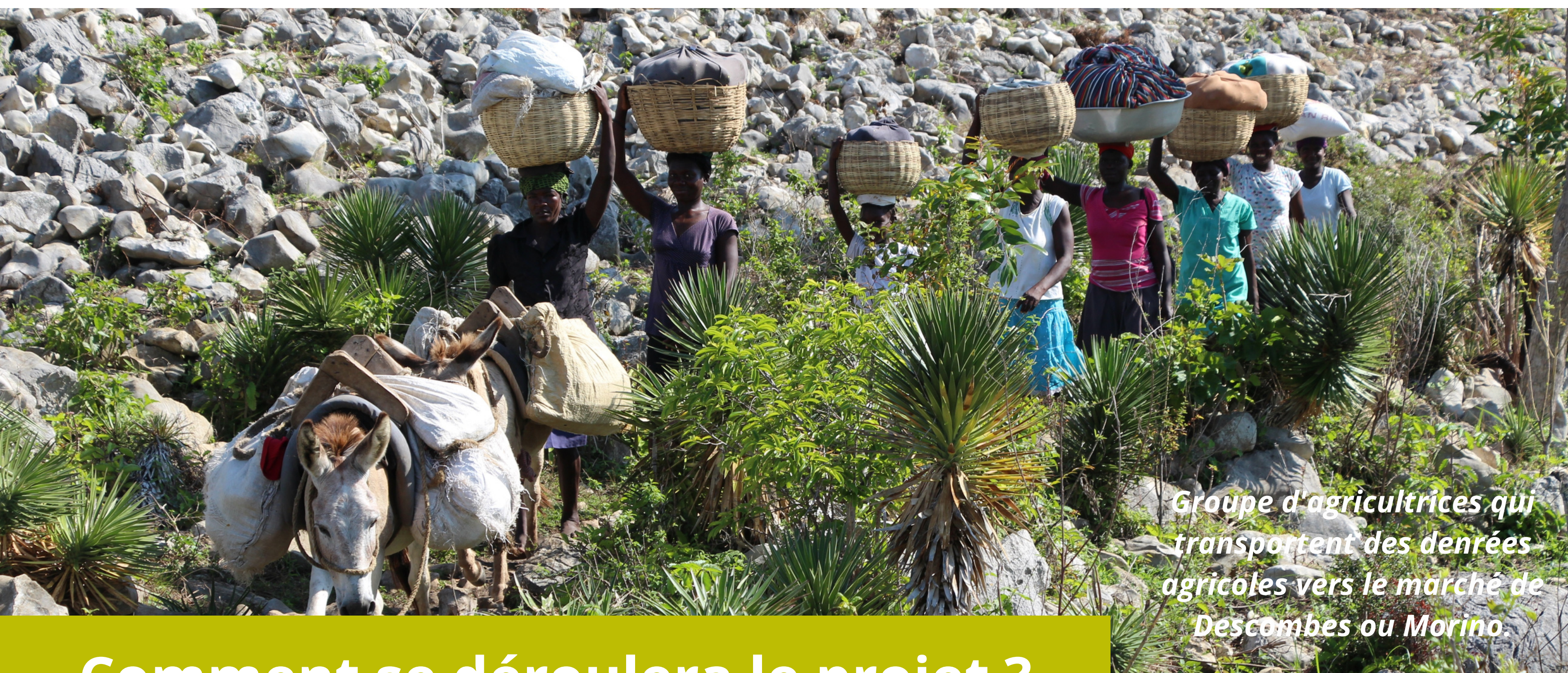
Groupe d'agricultrices qui transportent des denrées agricoles vers le marché de Descombes ou Morino.