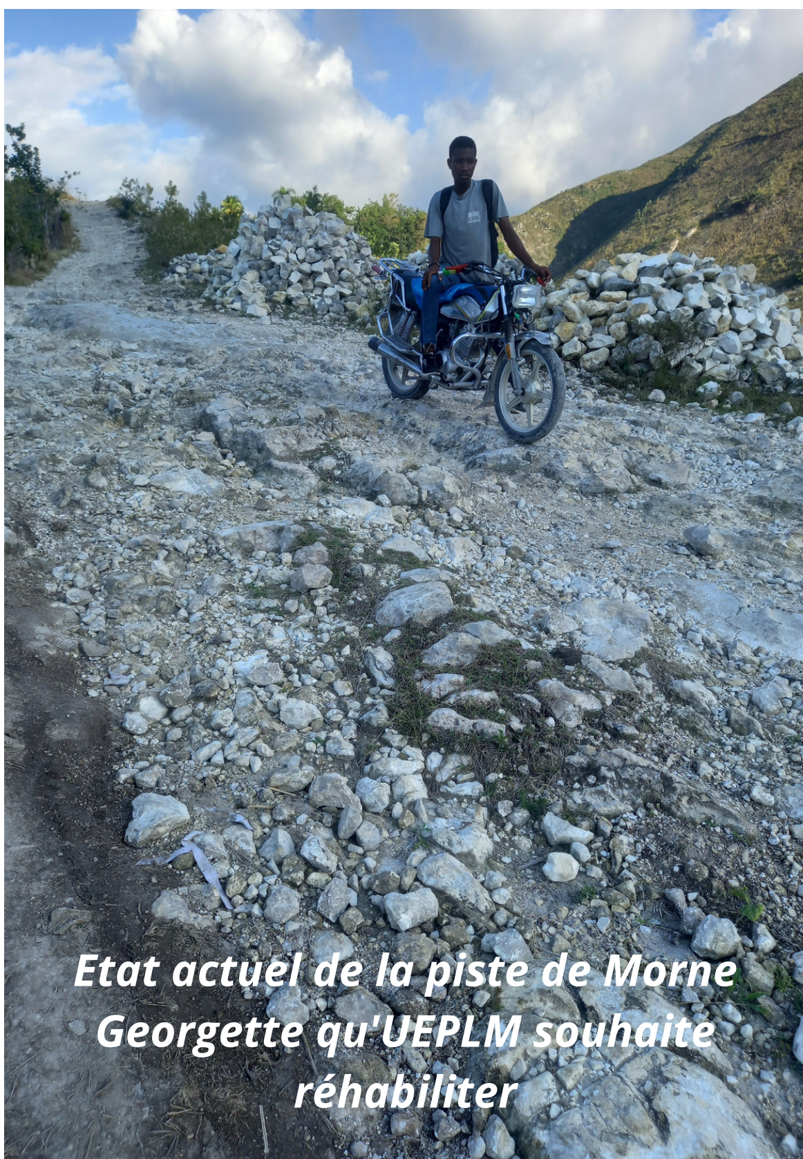
Etat actuel de la piste de Morne Georgette qu'UEPLM souhaite réhabiliter

Outre son enclavement, la région est caractérisée par un accès à l'eau très difficile . Les femmes et les enfants s'approvisionnent quotidiennement auprès de sources éloignées, dont l'accès est rendu compliqué par des chemins escarpés . De plus, les intempéries dues au changement climatique rendent souvent ces chemins impraticables , allant parfois jusqu'à couper les populations de la Chaîne des Matheux des autres localités et villes situées en contrebas.