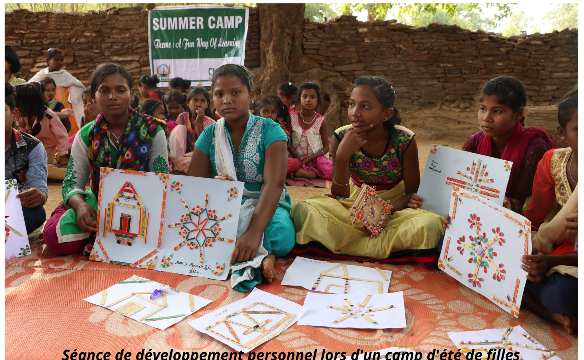
Séance de développement personnel lors d'un camp d'été de filles

Les jeunes filles bénéficiaires (1000) seront suivies par des consultants formés en science du comportement.