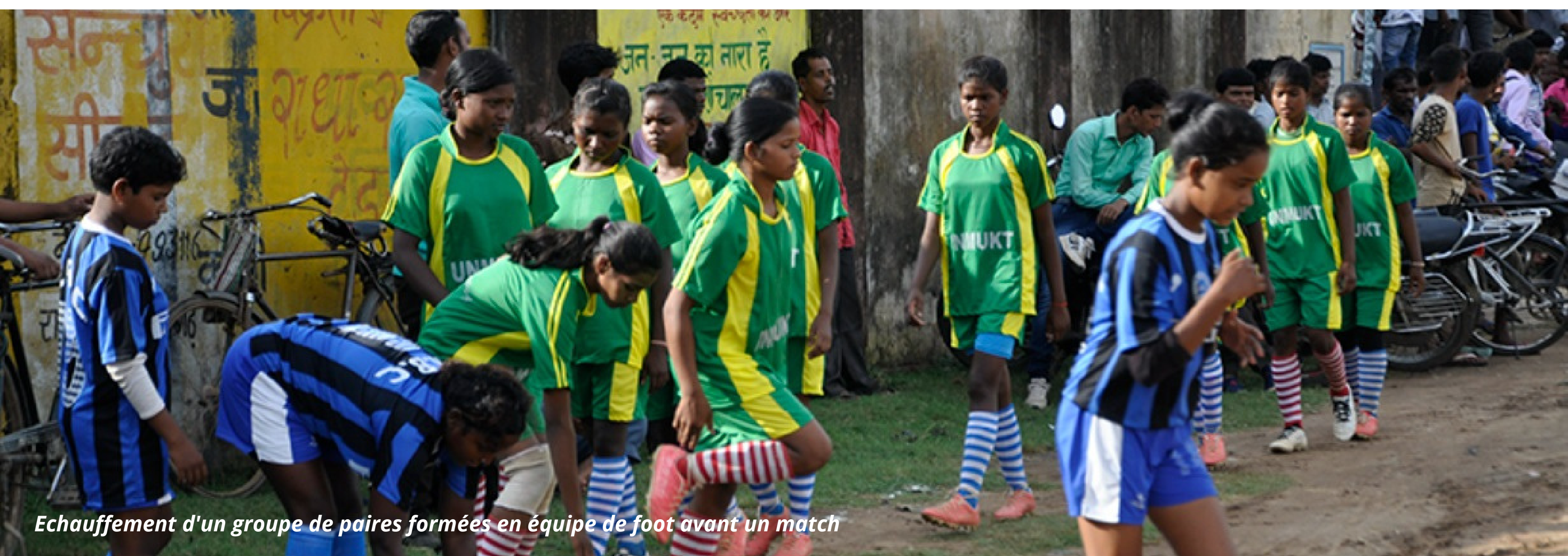
Echauffement d'un groupe de paires formées en équipe de foot avant un match

Ce modèle est évolutif et pourra être répliqué et adapté face aux leçons tirées. L'approche prometteuse qui en découlera aidera le gouvernement et les principales parties prenantes à se mobiliser pour obtenir de meilleurs et rapides résultats lorsqu'il s'agit d'éduquer les filles et de leur permettre de construire leur avenir.