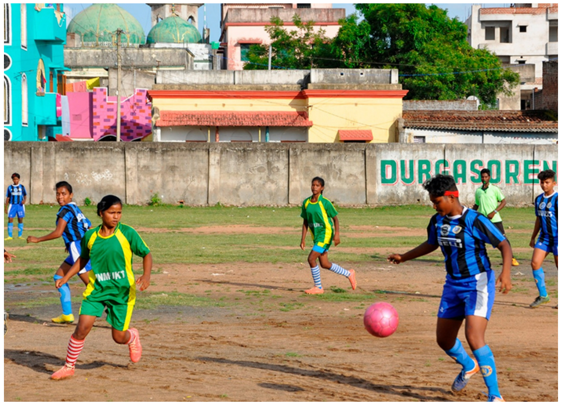
Equipe féminine de football formée dans le cadre d'un projet de lutte contre le mariage précoce dans l'Etat du Jharkhand (2016 - 2018)

Le sport sera la clé pour briser l'inhibition et aborder l'égalité des sexes et le mariage précoce. Ces groupes seront des espaces sûrs permettant de renforcer la confiance et l'apprentissage de soi, la compréhension de ses besoins et la définition d'objectifs de développement personnel. Les filles apprendront la valeur du travail d'équipe, de la détermination et du courage, qualités essentielles pour refuser le mariage précoce. Le projet impliquera les garçons adolescents en tant que partenaires essentiels dans les initiatives visant à créer des améliorations durables pour les filles et les femmes.