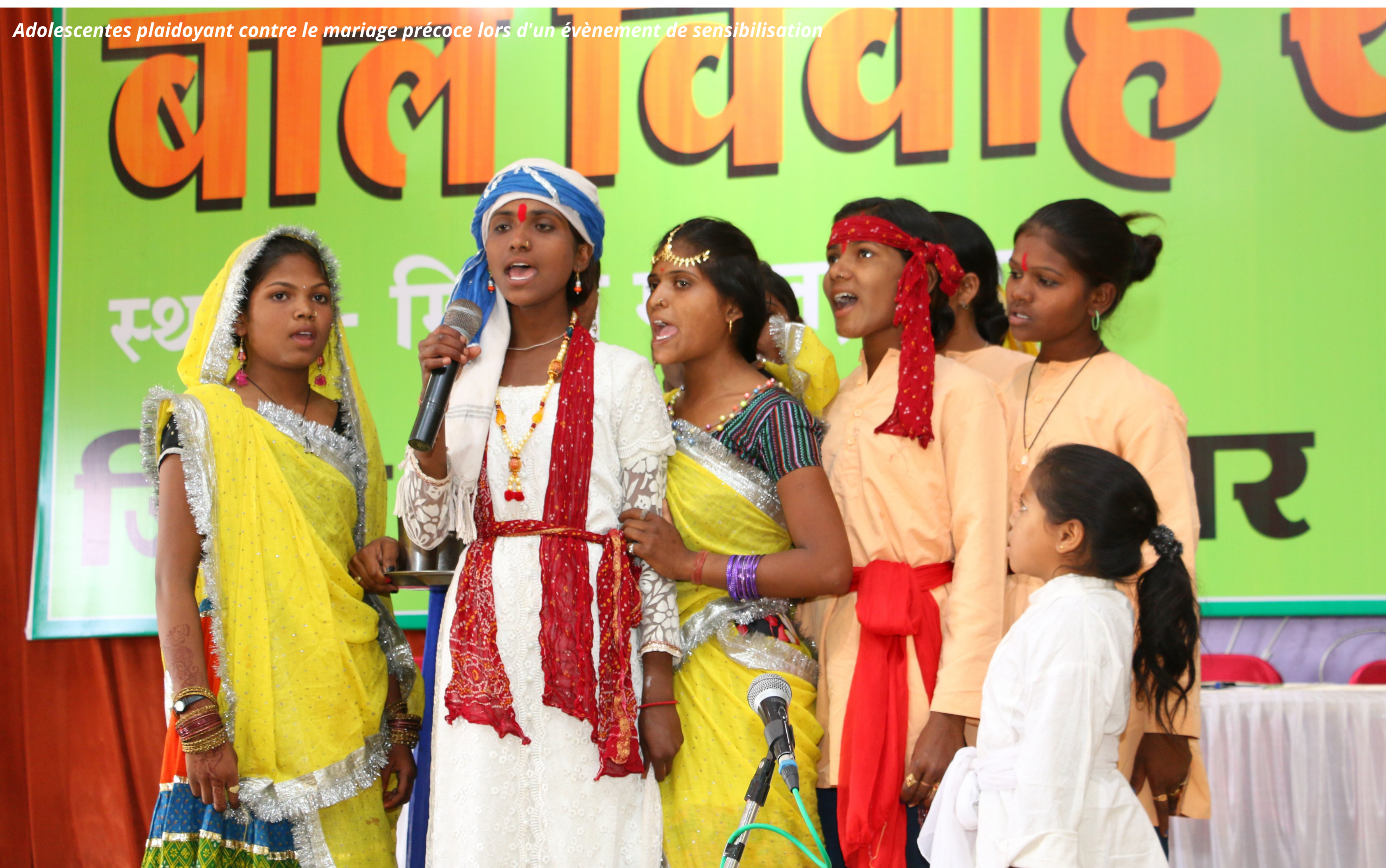
Adolescentes plaidoyant contre le mariage précoce lors d'un événement de sensibilisation

Ces groupes organiseront ensuite des sensibilisations de masse pour partager des histoires de réussite (via le sport, des peintures murales, des spectacles de danse ou de marionnettes, l'impression d'un calendrier annuel illustrant des messages clés de prévention...). Ces campagnes devraient atteindre plus de 1000 personnes. Ces interventions permettront aux jeunes de plaider pour l'inclusion de programme de lutte contre le mariage des enfants dans le plan de développement de leur village.