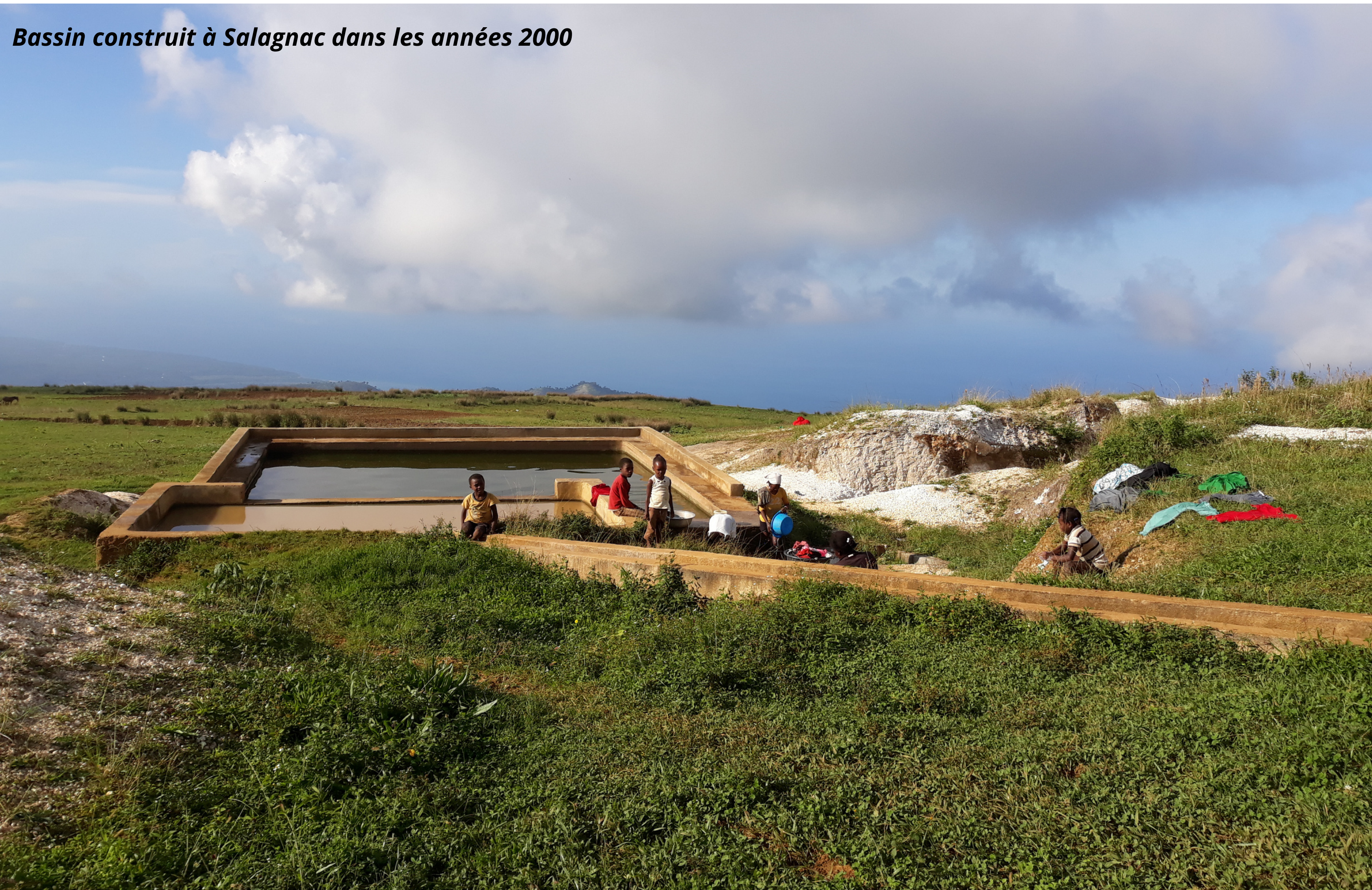
Bassin construit à Salagnac dans les années 2000