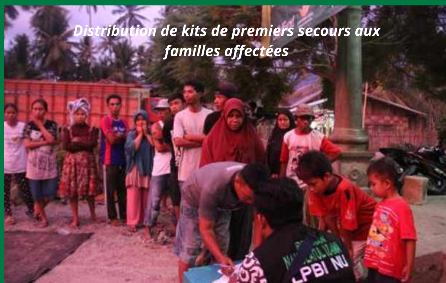
Distribution de kits de premiers secours aux familles affectées