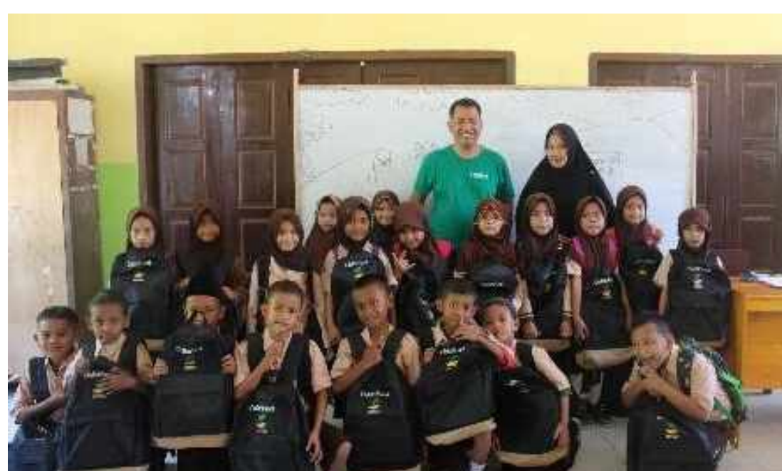
Distribution de kits scolaires

Un Enfant par la Main a pu participer à la réponse humanitaire en Indonésie, permettant de subvenir aux besoins de première nécessité des familles et de leur apporter un soutien psychosocial, un accès à l'éducation et au fonctionnement des mécanismes de protection de l'enfance.