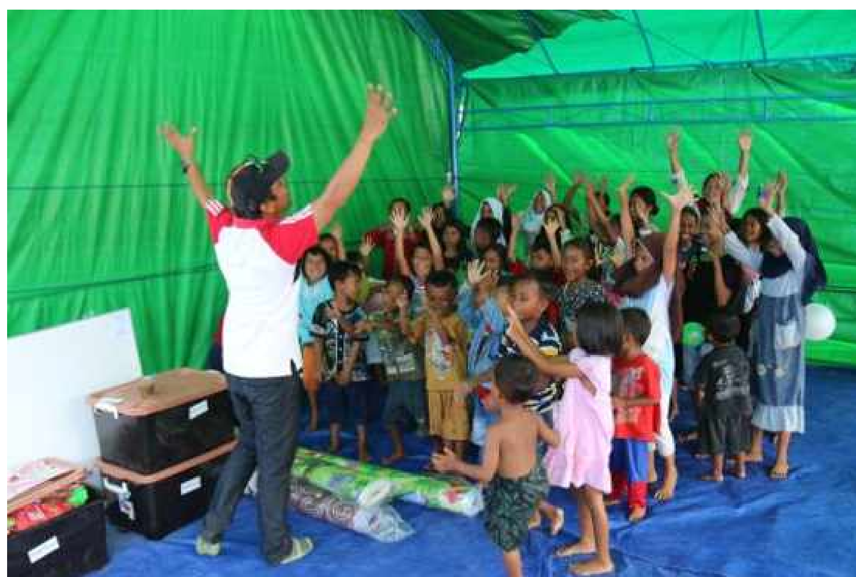
Un pair animateur conduit des activités récréatives avec les enfants pris en charge dans un Centre de réconfort