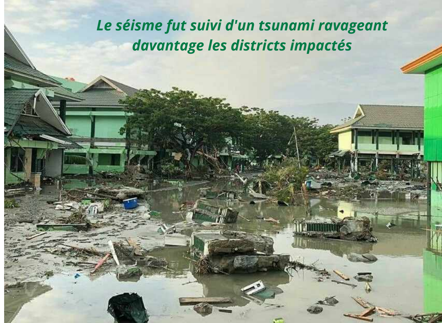
Le séisme fut suivi d'un tsunami ravageant davantage les districts impactés

Le 29 Septembre 2018, un séisme de magnitude 7.4 frappait l'île des Célèbes en Indonésie, suivi d'un tsunami ravageant les terres sur 20 km. Au total, plus de 2,4 millions de personnes ont été touchées dont 2000 sont décédées, 5000 disparues, 5000 blessées et près de 80 000 personnes déplacées. Les districts de Palu, Sigi et Donggala ont été particulièrement touchés. Dans les villes principales, plus de 70% des infrastructures se sont effondrées, impactant l'accès à l'eau et donc les risques sanitaires. Plus de 190 000 personnes, dont 46 000 enfants plus vulnérables que jamais, se sont retrouvés en situation d'urgence et d'aide humanitaire.