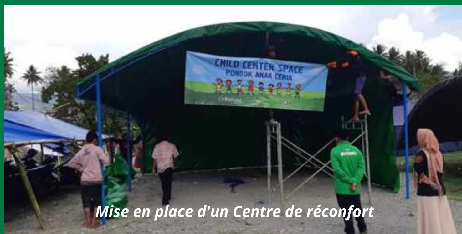
Mise en place d'un Centre de réconfort

UEPLM a pu participer à la réponse humanitaire coordonnée par ChildFund Indonésie, en partenariat avec une ONG locale, LPBI NU. Des kits de premiers secours ont été distribués à 2000 familles (2704 enfants). Des toilettes et robinets ont été installés dans 10 villages, améliorant la situation sanitaire de 936 familles. Des Centres de réconfort (10) ont été mis en place, centrés sur le bien-être des enfants, et via lesquels des séances de soutien psychologique post-catastrophe, d'écoute et de discussion entre jeunes et enfants ont été organisées. Ces séances ont été animées par 49 jeunes animateurs volontaires ayant suivi des formations encadrées par des psychologues. Ce sont 1163 enfants qui ont pu bénéficier de ce soutien ainsi que d'espaces de jeux et d'activités récréatives pour poursuivre leur développement. 3503 kits scolaires ont été distribués et des salles de classes semi-permanentes (39) ont été construites dans 11 écoles pour permettre à 1600 écoliers de poursuivre un programme d'éducation informel pendant 6 mois. Des enseignants (19) ont reçu une formation à la réduction des risques de catastrophes. Enfin, ChildFund Indonésie a accompagné les membres de la communauté dans la phase initiale de rétablissement des mécanismes de protection de l'enfance en organisant 11 réunions dans les Centres de réconfort, faisant participer 414 personnes, dont 78 enfants.