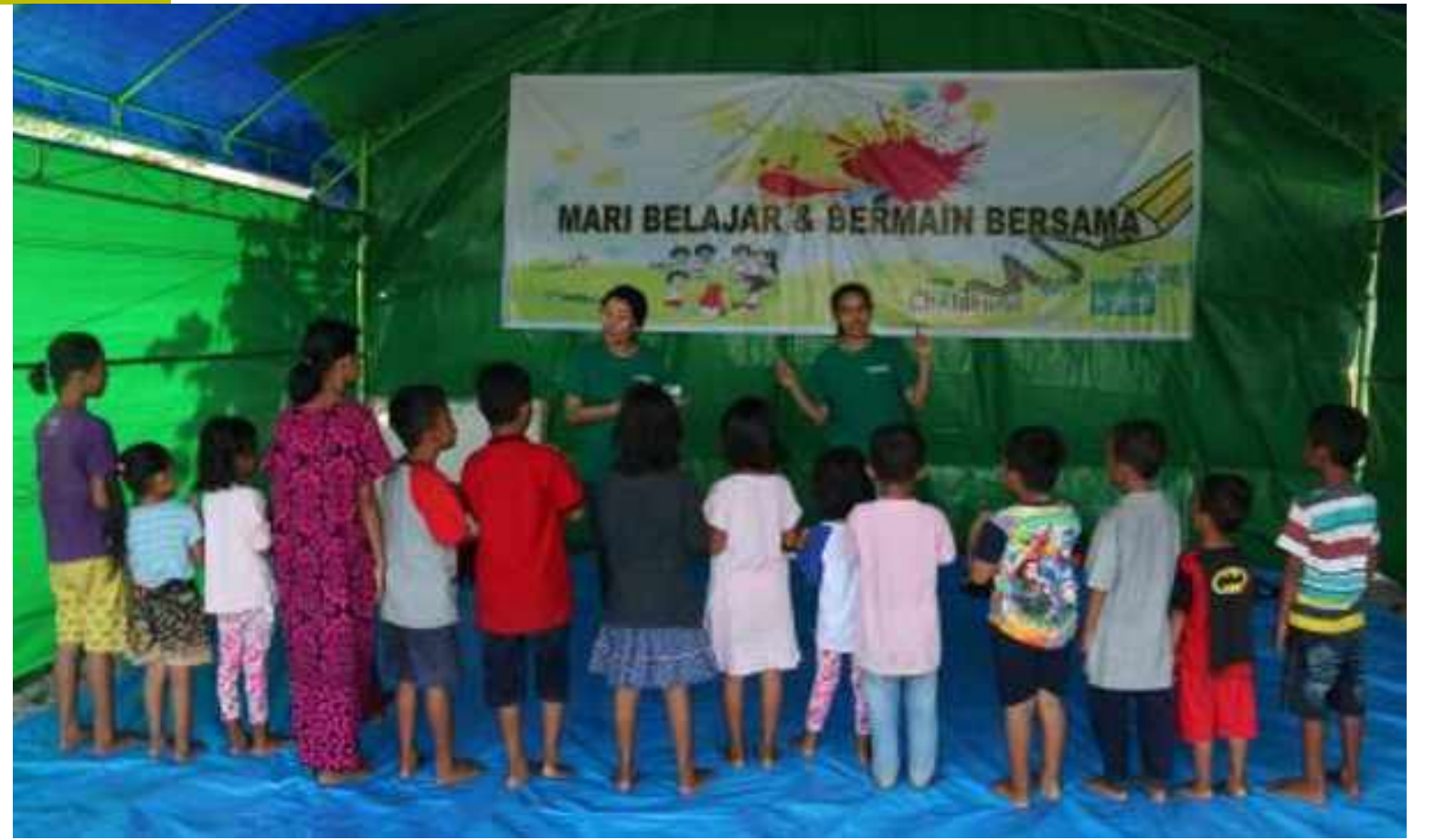
L'équipe ChildFund anime des séances de sensibilisation aux droits de l'enfant dans un Centre de réconfort

Grâce aux activités mises en place avec le soutien des partenaires ChildFund Alliance, une aide humanitaire et un soutien psychologique ont pu être apportés à des milliers d'enfants. Le système de soutien aux enfants a été renforcé grâce aux pairs animateurs et aux Centres de réconfort. Les témoignages recueillis auprès de la communauté sont extrêmement positifs : les enfants ont pu retrouver un sentiment de normalité et une estime de soi via l'apprentissage et le jeu dans les 3 mois suivant le désastre. Avec les pairs animateurs, ils ont été alertés sur les réflexes et comportements à adopter en cas de catastrophe. Les enfants sont moins exposés aux abus et à la violence à la maison, dans des familles résilientes et respectueuses des droits de l'enfant, grâce au soutien psychologique dont elles ont bénéficié. Les Centres de réconfort vont continuer à accueillir les familles, avec l'appui de nouvelles ONG partenaires locales, et de nouvelles salles de classe vont être construites dans les écoles n'ayant pas encore bénéficié de soutien en infrastructure. L'objectif désormais est de s'orienter, en partant du modèle des Centres de réconfort, vers un modèle basé sur la communauté, afin de développer des systèmes de protection de l'enfant durables. Les structures communautaires existantes continueront d'être renforcées pour améliorer leurs compétences en matière d'intervention d'urgence et de planification de la réduction des risques.