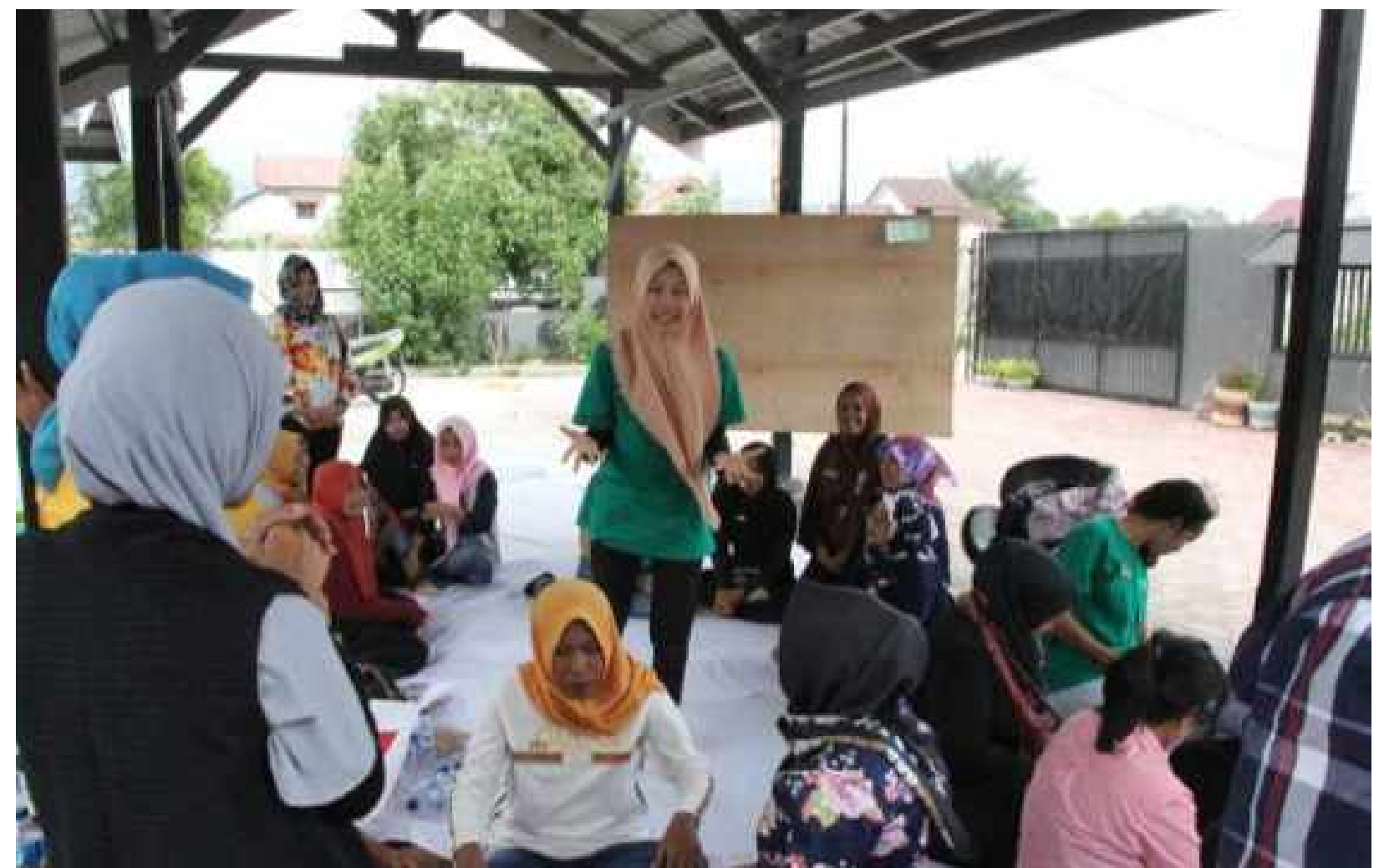
Formation de pairs animateurs