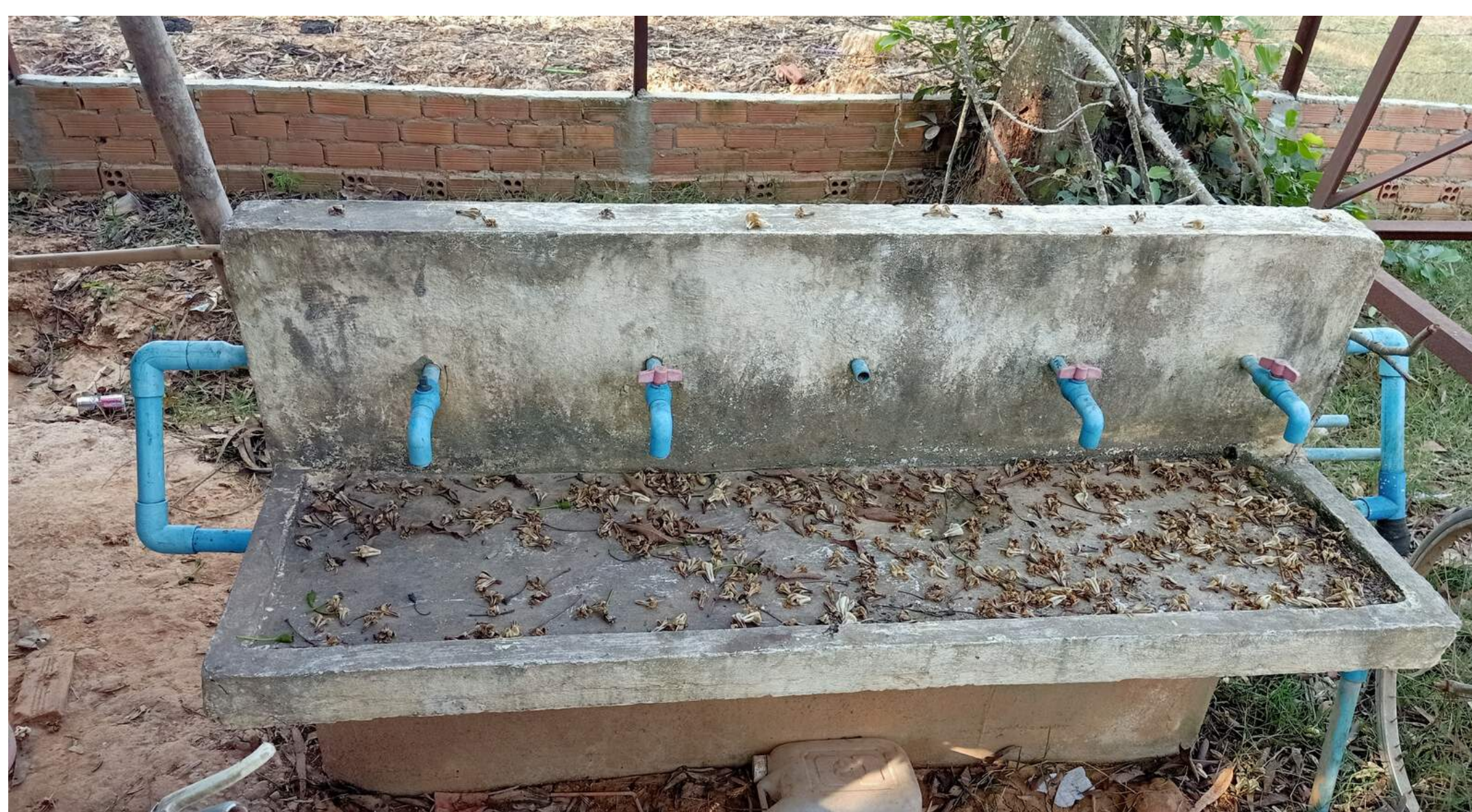
L'état des lavabos dont disposent les élèves de l'école primaire, District de Kampong Trabaek