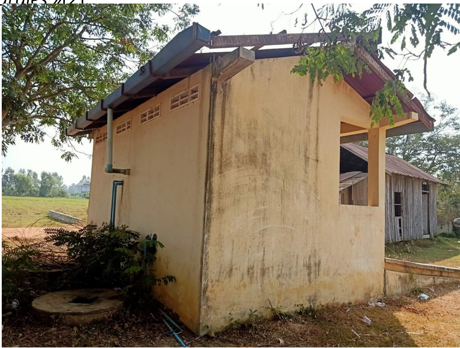
Bloc sanitaire de l'école primaire Tuol Roka, district de Kampong Trabaek

Au niveau du secteur de l'éducation, environ 6 écoles sur 10 n'ont pas accès aux installations sanitaires de base. Dans ses dernières recommandations adressées au Cambodge, le Comité des droits de l'enfant a exprimé sa préoccupation quant au fait que l'Etat signataire soit « encore dépourvu d'infrastructures scolaires, notamment de commodités comme les toilettes et l'alimentation en eau potable, (...) en particulier dans les régions rurales » [2]