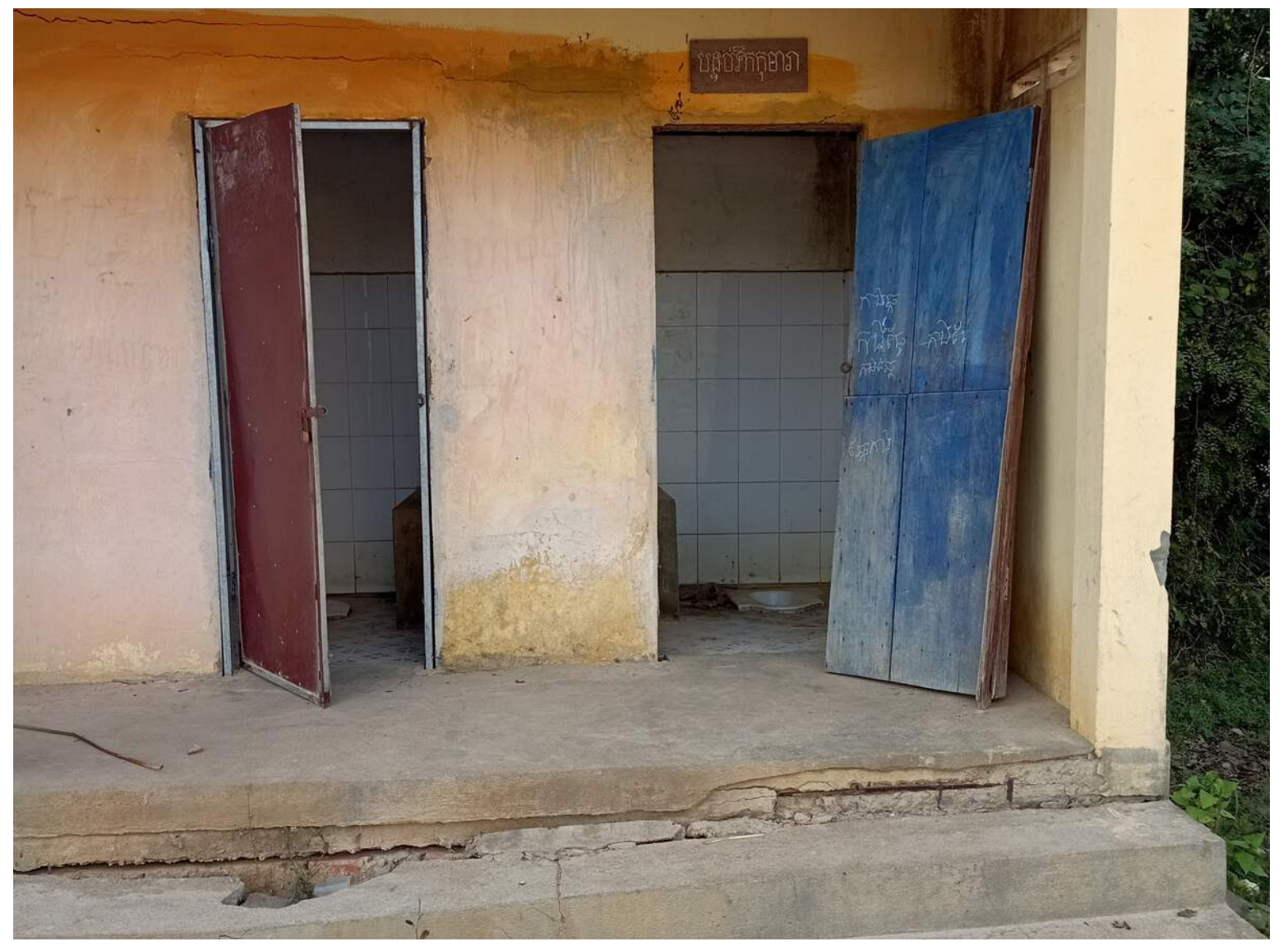
Blocs sanitaires de l'école primaire Beng Borei, district de Kampong Trabaek

ChildFund Cambodge, en partenariat avec l'association locale Santi Sena Organisation et les autorités locales, prévoit la construction et la rénovation de latrines, de dispositifs pour le lavage des mains et l'installation de filtres à eau , au sein de dix écoles du district de Kampong Trabaek (Thkov, Chrey, Pratheat, Ansoang, Prey Paun et Kampong Trabaek), et planifie de sensibiliser l'ensemble de la communauté et d'instaurer de nouvelles pratiques afin de réduire les risques sanitaires.