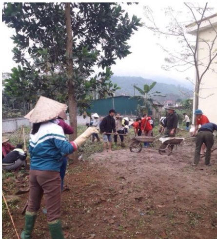
Les parents d'élèves ont participé activement au projet. Ici, le nettoyage du sol préalable à la construction de la dalle en béton

Ces avancées sont le résultat d'une forte implication des différentes parties prenantes, notamment les autorités communales mais également les professeurs et les parents d'élèves. Ils se sont ainsi appropriés le projet et prendront soin des structures installées.