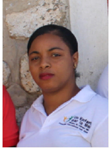
Lourdrige Animatrice parrainages