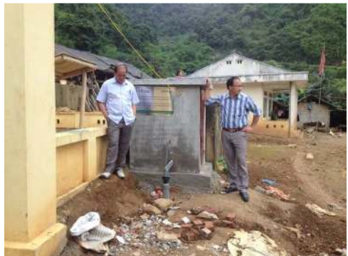
Installation du système d'accès à l'eau