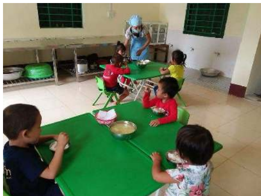
Cantine avec au fond la zone de préparation des repas et les points d'eau

Au nom des enfants, de leur famille et de toute l'équipe de Childfund Vietnam, nous remercions l'Abbaye Notre Dame de Lerins, l'association Talents et Partage, la Fondation d'entreprise Laboratoires Lescuyer, les entreprises Société Générale, la Société des Courses de la Côte d'Azur, la Société des Course Lyonnaises, NS Partner, Univers Club Auto, le Lions Club, l'association des étudiants de l'IUT de Nice « Un tournoi, un espoir » et l'ensemble des donateurs pour leur soutien sur ce projet qui permet aujourd'hui aux enfants de l'école maternelle de Thang Sap d'aller à l'école toute la journée et de manger à leur faim dans de bonnes conditions.