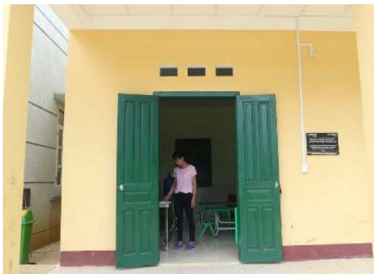
Entrée de la cantine

Les parents se disent heureux de ce projet, les repas peuvent désormais être préparés sur place et donc ils n'ont plus besoin de venir chercher leur(s) enfant(s) à l'heure du déjeuner. Les enfants peuvent rester à l'école toute la journée, et leurs parents ont davantage de temps à consacrer à leurs activités professionnelles.