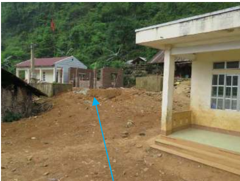
Construction de la cantine