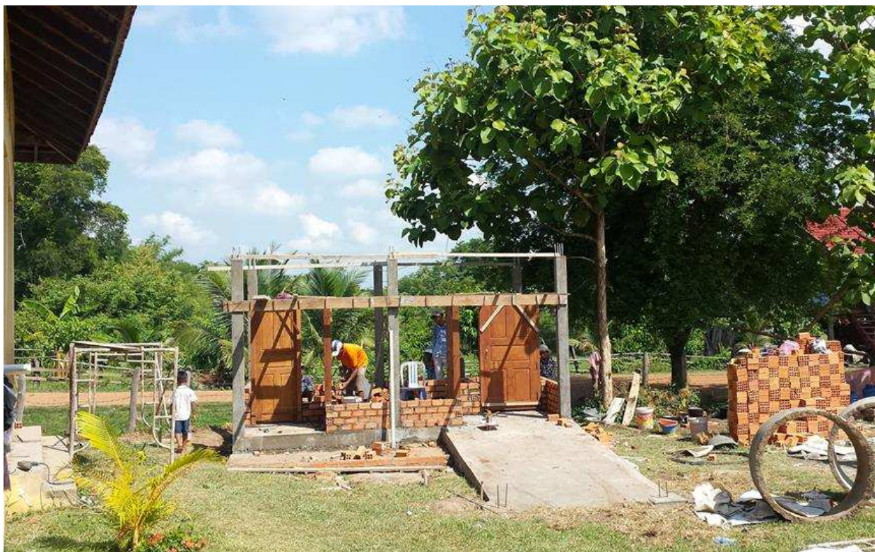
Construction des murs