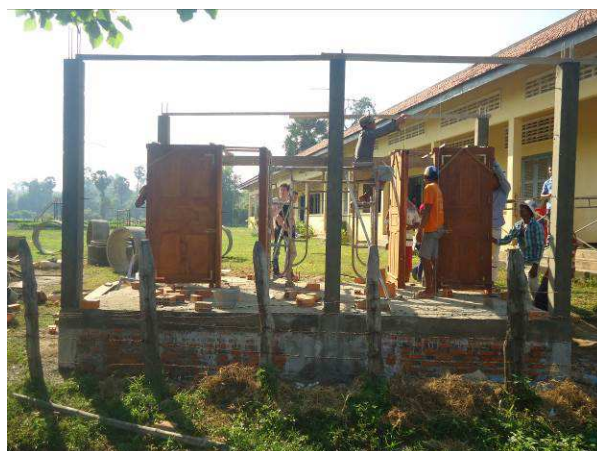
Installation des portes