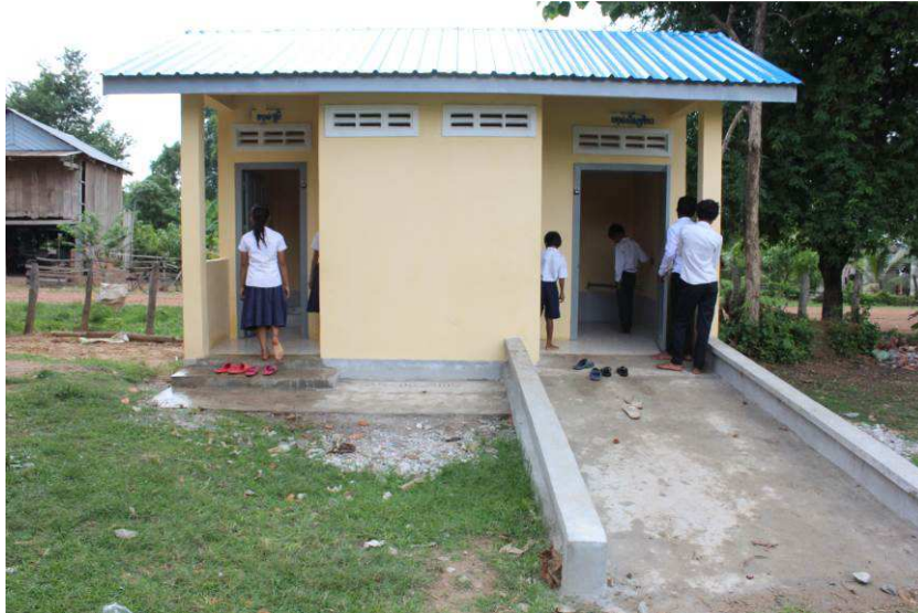
Le bloc de 4 toilettes a été bien construit, les enfants et leurs professeurs ont ainsi accès à une infrastructure de qualité.