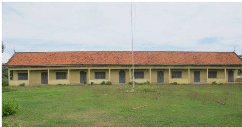
Ecole primaire de Boeng Kieb

Ce projet a permis de mettre en place un bloc de toilettes au sein de l'école primaire Boeng Kieb dans le village du même nom, située à 20km de Kratié la ville principale de la province.