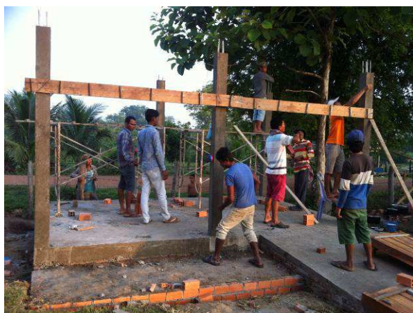
Bases de la construction

Trois toilettes à la turque et un toilette accessible aux enfants ou adultes qui se déplacent en fauteuil roulant ont été construits. Le toit est en tôle, il y a deux fosses septiques et un réservoir de filtration permettant à l'eau d'être rejetée dans la nature sans pollution de la terre. Le réservoir d'eau existant a été installé au sein de la construction permettant ainsi d'amener l'eau pour l'utilisation des toilettes. Une pompe pour acheminer l'eau du forage jusqu'au réservoir a aussi été installée.